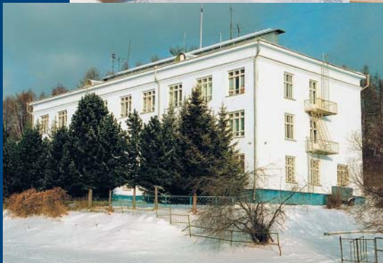
Здание Байкальского музея, пос. Листвянка