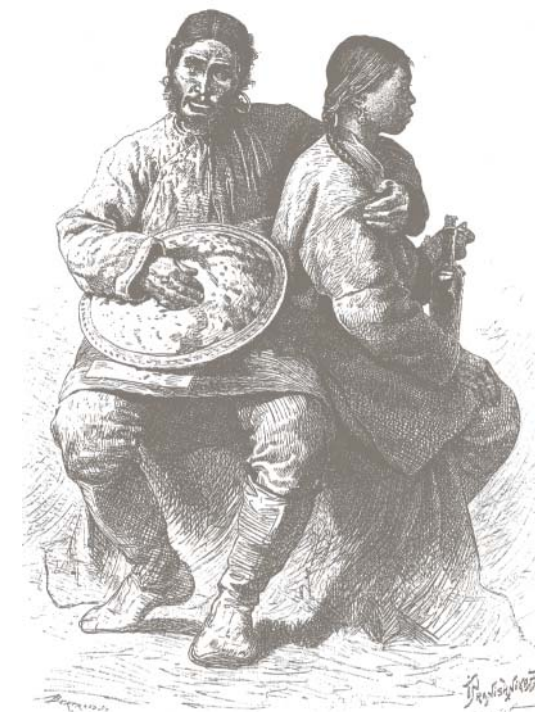
Гольды (нанайцы). Литография XIX века

<...> Из того, что какой-либо народ покорился добровольно, нельзя делать вывод о его робости. Тунгусы, напротив, в целом так храбры и мужественны, как только может быть народ. Причина скорее в следующем. Те, кто кочует по лесам, чаще всего держатся отдельными семьями, следовательно у них было легко схватить одного или несколько человек, которые были аманатами или заложниками, и которых прежде держали во всех городах и острогах. И тогда естественная доброта и искренность народа, если они не хотели бросить своих аманатов на произвол судьбы, и была истинной причиной их покорности. Наоборот, у других народов, которые занимаются скотоводством и живут близко друг к другу в степях или поселениями,