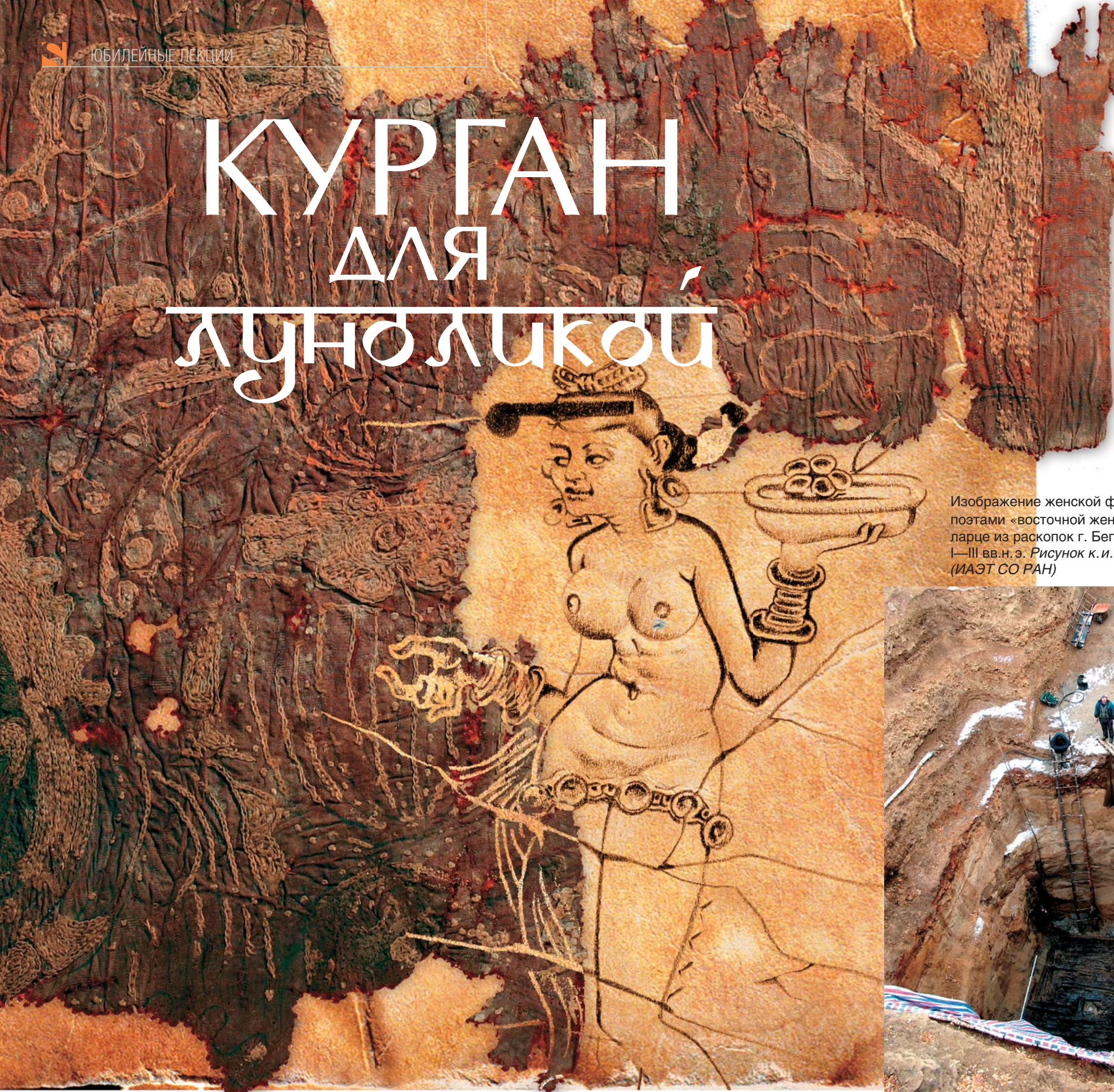
Изображение женской фигуры – типичной, воспетой поэтами «восточной женщины» – на резном костяном ларце из раскопок г. Беграма (древ. Каписа). I–III вв. н. э. Рисунок к. и. н. Д. Позднякова (ИАЭТ СО РАН)