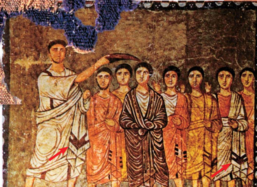
Миропомазание Давида. Стенная роспись синагоги в г. Дура-Европос. По: (Шлюмберже, 1985). Красными стрелками показан зубчатый орнамент на одеждах, совпадающий по рисунку с уцелевшим фрагментом орнамента на шерстяной ткани, найденной при раскопках в Пальмире