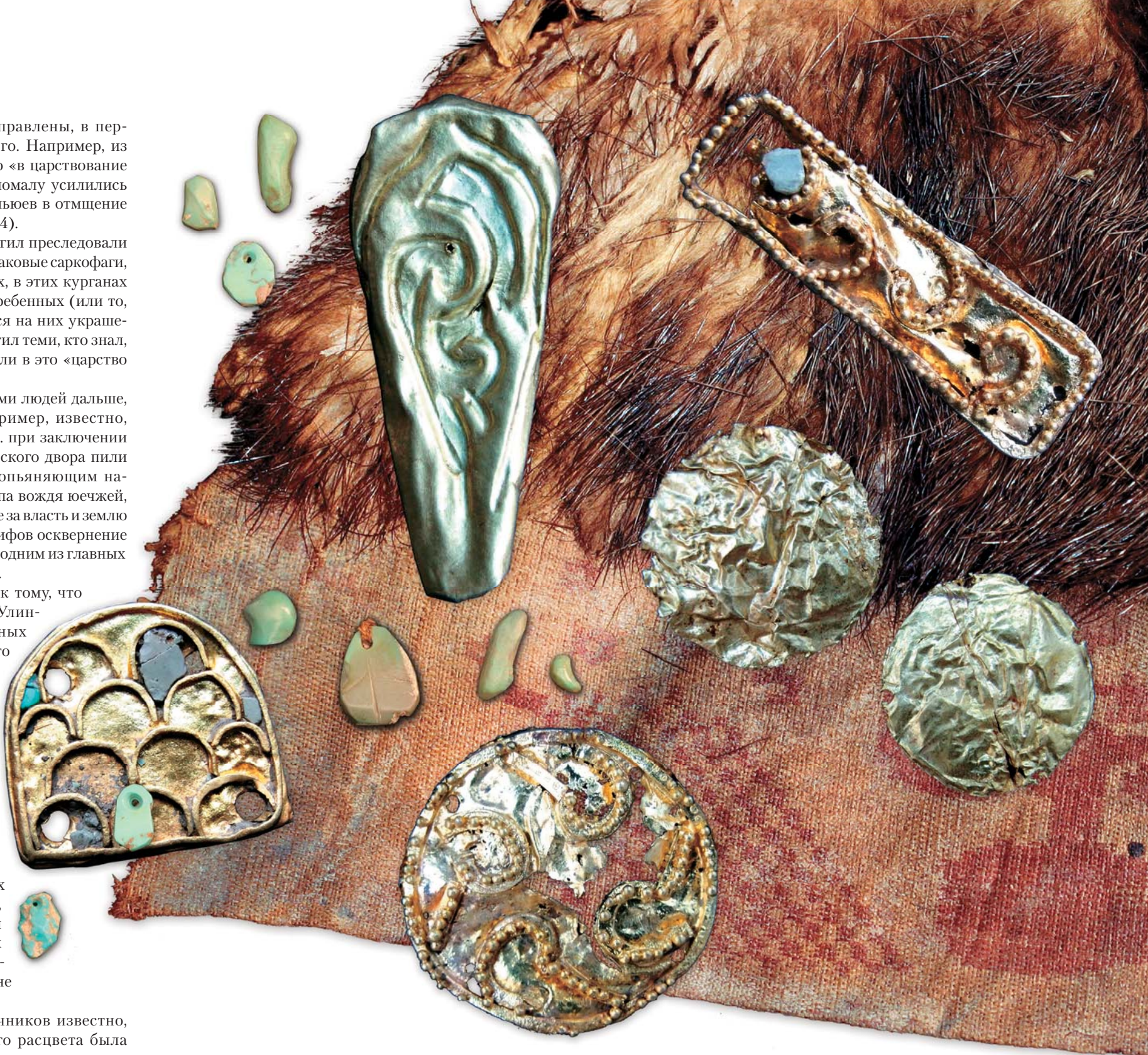
Из погребальной камеры 20-го кургана Ноин-Улинского могильника хунну, расположенной на глубине 18 м, были извлечены многочисленные предметы, сопровождавшие умершего в загробный мир. Среди них – украшения из золота и бирюзы, остатки шелковых и шерстяных одежд