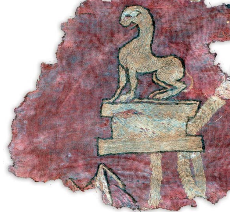
Расшитая шерстяная завеса из 20-го Ноин-Улинского кургана