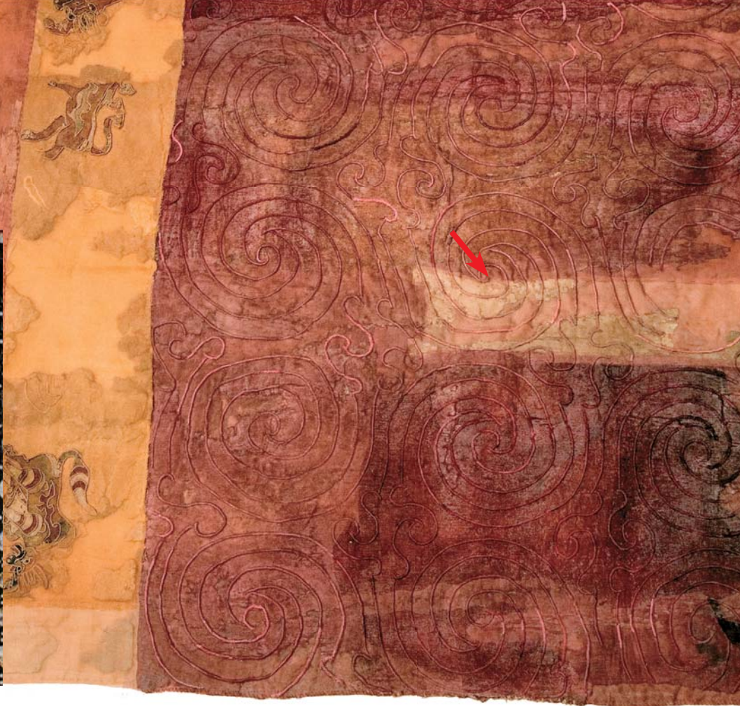
Ткань из 20-го Ноин-Улинского кургана, которая покрывала войлочный ковер и была простегана шерстяными шнурами, имеет аналоги среди фрагментов тканей, обнаруженных при раскопках на территории Парфии, например в Пальмире. Все ткани отличаются характерным орнаментом в виде мерлонов (зубцов). Этот же орнамент встречается и на туниках мужчин, изображенных на фресках в синагоге в Дура-Европосе – городе, до середины II в. н. э. находившемся под властью парфян