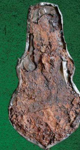
Серебряная бляха (лицевая и оборотная стороны) – украшение конской упряжи из могильника хунну Ноин-Ула. Раскопки российско-монгольской экспедиции. 2006 г.