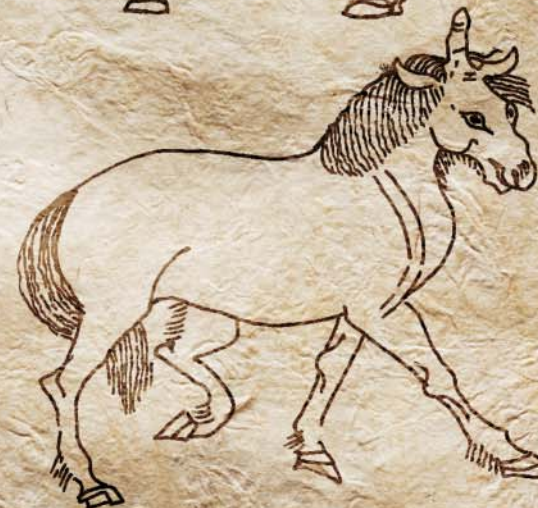
Изображение единорога на серебряной пластине из клада с о. Сарк (Великобритания). Пластина была найдена в 1718 г., но затем утеряна. В 1966 г. были обнаружены только сделанные с нее рисунки