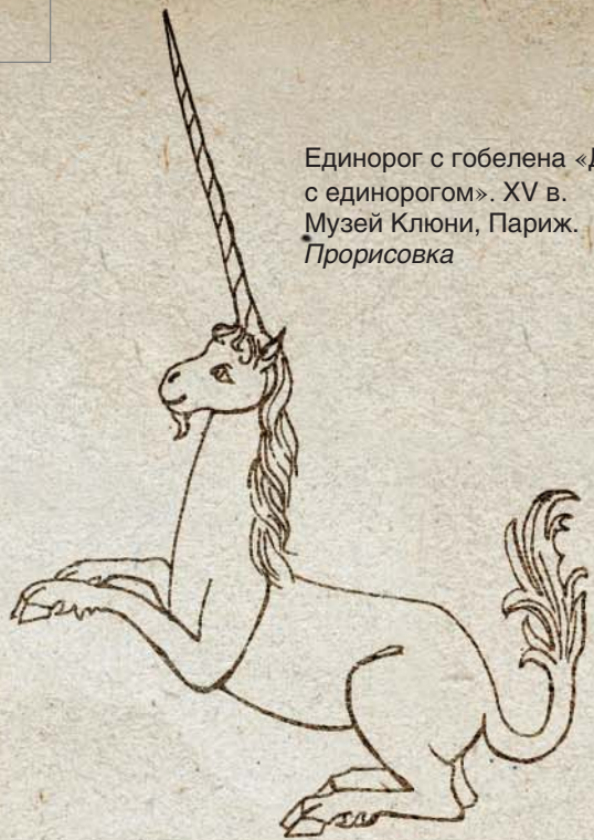
Единорог с гобелена «Дама с единорогом». XV в. Музей Клюни, Париж. Прорисовка

Анималистический герб из гербовника Конрада Грюнеберга! У изображения единорога ноги как у буйвола, большой рог надо лбом. Конец XV в. По: (Пастуро М. Геральдика, 2003)