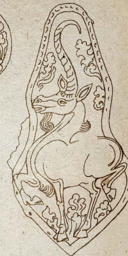
Серебряные бляхи – украшения конской упряжи из могильника хунну Гол-Мод (Монголия). Прорисовка. Раскопки француско-монгольской экспедиции. 2002—2005 гг.

Ханьского императора У-ди изображения марала как изображение цилиня и объявил, что это – знамение возвращения справедливости. Как бы подтверждением этого пророчества стало то, что через год хуннский шаньюй сдался У-ди вместе с многотысячной армией.