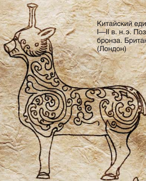
Китайский единорог. I–II в. н. э. Позолоченная бронза. Британский музей (Лондон)