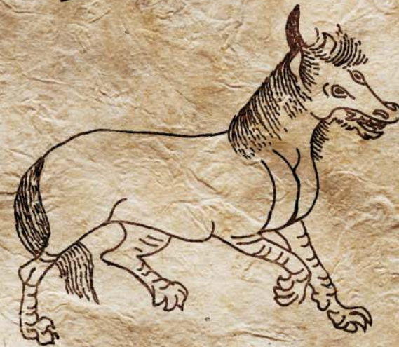
Китайский единорог-хищник Бо из книги «Шань-хай цзин». Бо обладает тигриными зубами и когтями По: (Терентьев-Катанский, 2004)

«Белая лошадка с передними ногами антилопы, козлиной бородой и длинным, торчащим на лбу винтообразным рогом» (обычное описание этого фантастического зверя, приведенное Хорхе Луисом Борхесом в его знаменитой «Книге вымышленных существ») появится только в XV в. Именно таким изображен единорог на знаменитом гобелене «Дама с единорогом» из музея Клюни. В геральдическом bestiarii средневековой Европы единорог – один из наиболее часто встречающихся монстров и химерических животных (Пастуро, 2003). В неизменном виде он дожил до наших дней в государственных гербах Великобритании и Канады.