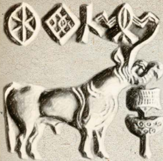
Индийский единорог. Оттиск печати из долины Инда. III тыс. до н. э.

Истоки образа единорога теряются в глубине веков. Считают, что его первые изображения в виде однорогого быка присутствуют на печатях древних городов долины Инда – Мохенджо-Даро и Хараппы (III тыс. до н. э.). Возможно, к подобному изображению можно было бы отнести, как к виду быка в профиль, если бы не упоминания единорога как одного из значимых священных символов в индийских «Атхарваведе» и «Махабхарате».