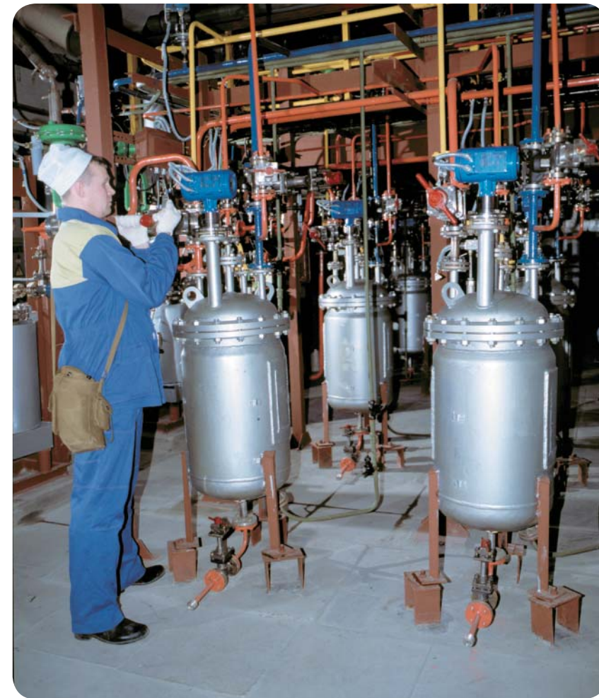
Редакция благодарит за помощь в подготовке материала к.г.-м.н. А.Н. Сутина, В.В. Минаева (ЛИН СО РАН), В.А. Короткоручко.

Химический завод комбината обладает одним из самых мощных в мире производств фтора, часть которого используется для получения ряда ценных фторсодержащих продуктов. Эти вещества применяются в качестве катализаторов в нефтехимии, являются основой для производства нового поколения антибиотиков, а также многочисленного ряда лекарств, гербицидов и красителей