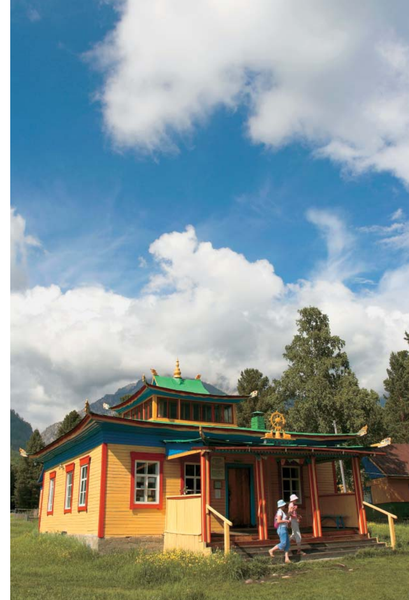
Аршанский дацан — буддийский храм