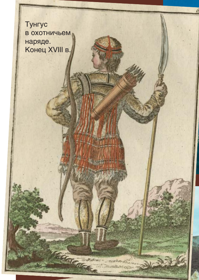
Тунгус в охотничьем наряде. Конец XVIII в.

В августе 1744 года Стеллер почел свою миссию выполненной и через Охотск и Якутск поехал обратно. В столицу.