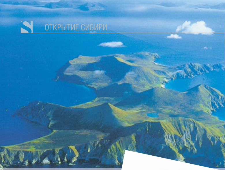
Остров Шумагина.