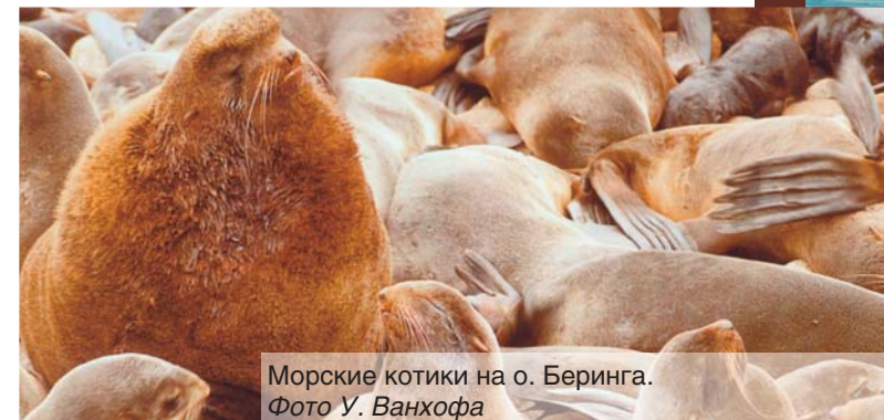
Морские котики на о. Беринга.

слишком жизнерадостен и бесшабашен для этого. Но сам образ немецкого «железа», намертво вязнущего в русском «тесте», многое может объяснить. И лежит это как-то вне оценочных характеристик: «Железо хорошо, а тесто плохо», или наоборот. Всеу свое время и свое место. Неслучайно и то, что лесковская повесть была впервые переиздана и как бы обрела второе дыхание в годы Великой Отечественной войны. Во всяком случае, тут есть, о чем подумать.