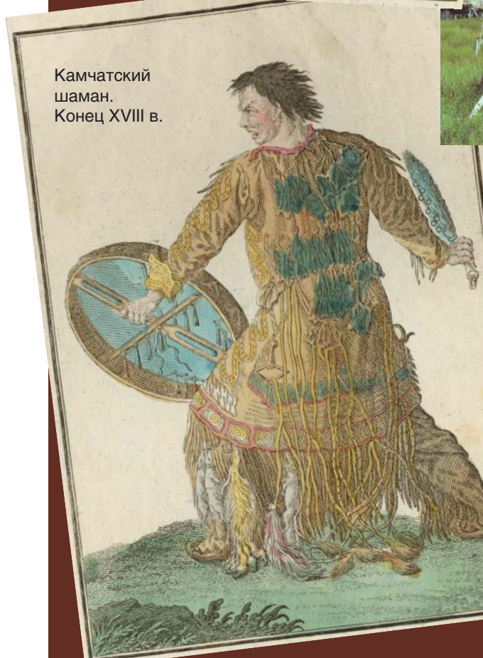
Камчатский шаман. Конец XVIII в.