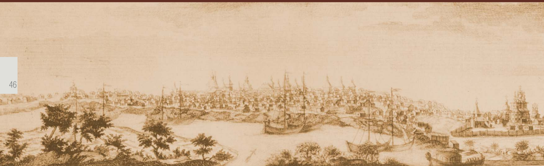
Якутск (1753 г.)