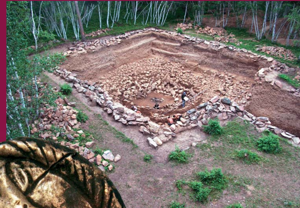
Первое из пяти каменных перекрытий могильной ямы