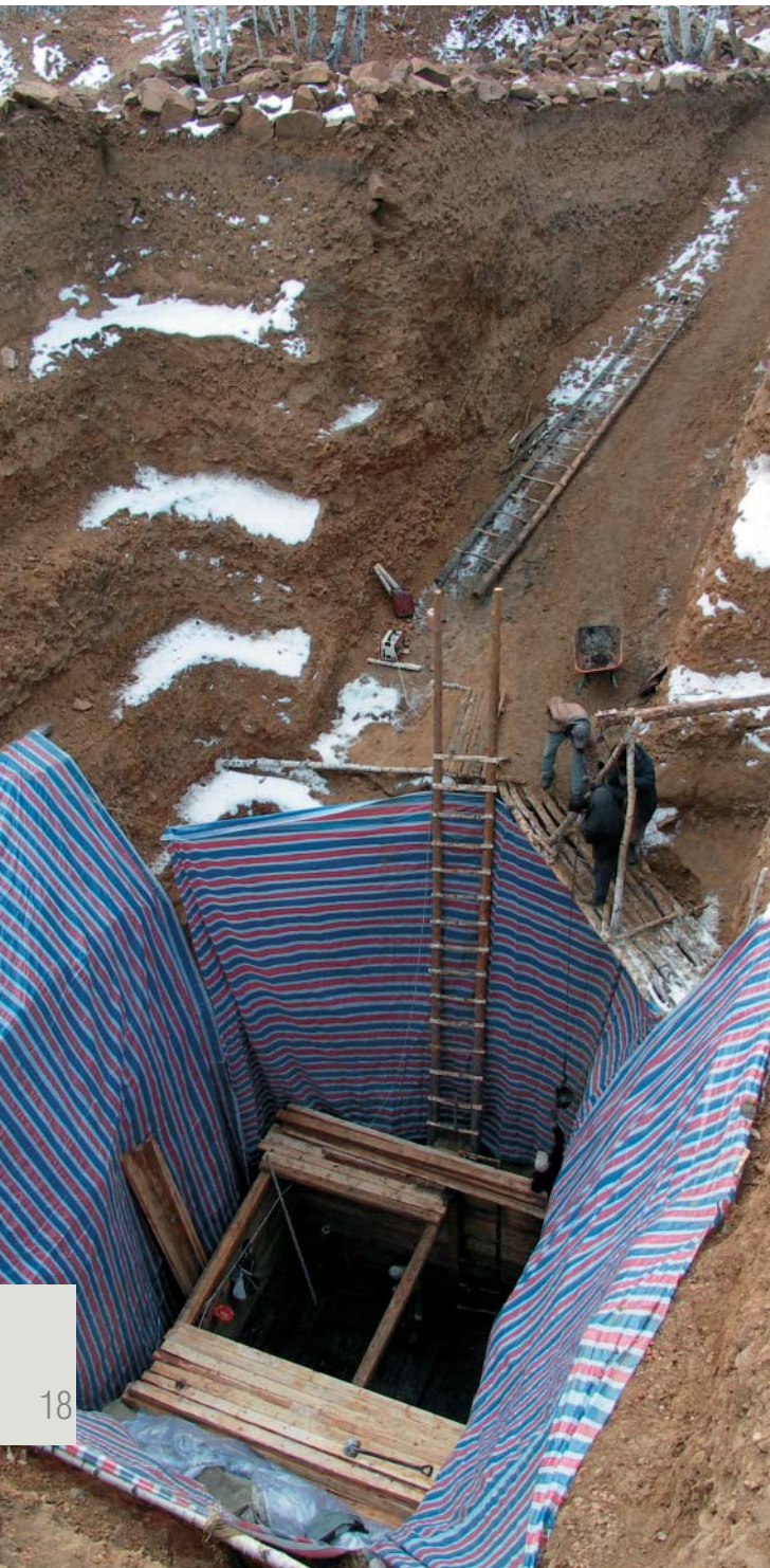
На дне раскопа для безопасности и в связи с началом «снежного» сезона сооружен сруб из бруса, в котором и ведутся все работы. Стены задрапированы, чтобы предотвратить осыпание грунта. Ноябрь, глубина раскопа 18 м 38 см