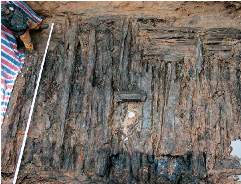
Перекрытие погребальной камеры — обгоревшие сосновые бревна с прорубом, через который в древности был унесен погребенный