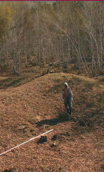
▼ Красный и черный лак — отпечатки колеса ханьской колесницы