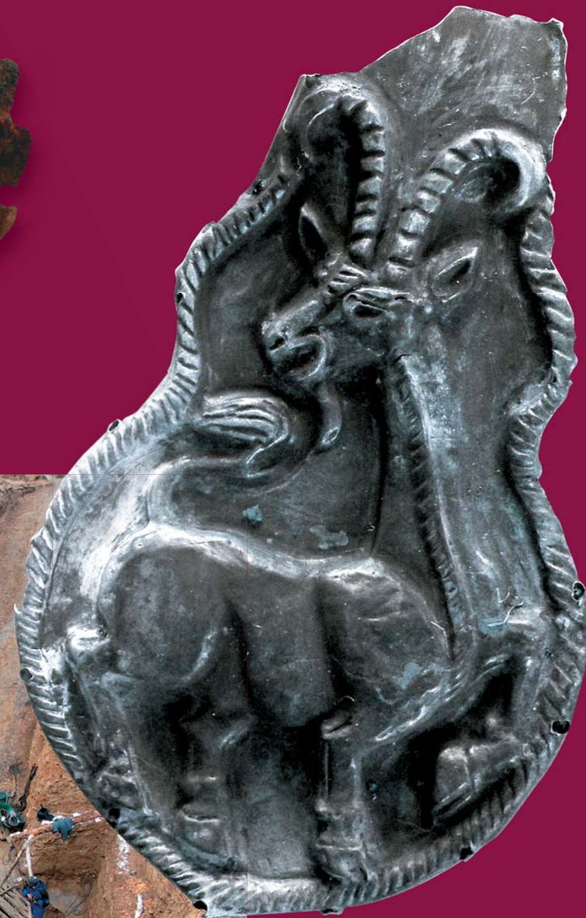
Украшение конской упряжи — серебряная бляха с изображением козла