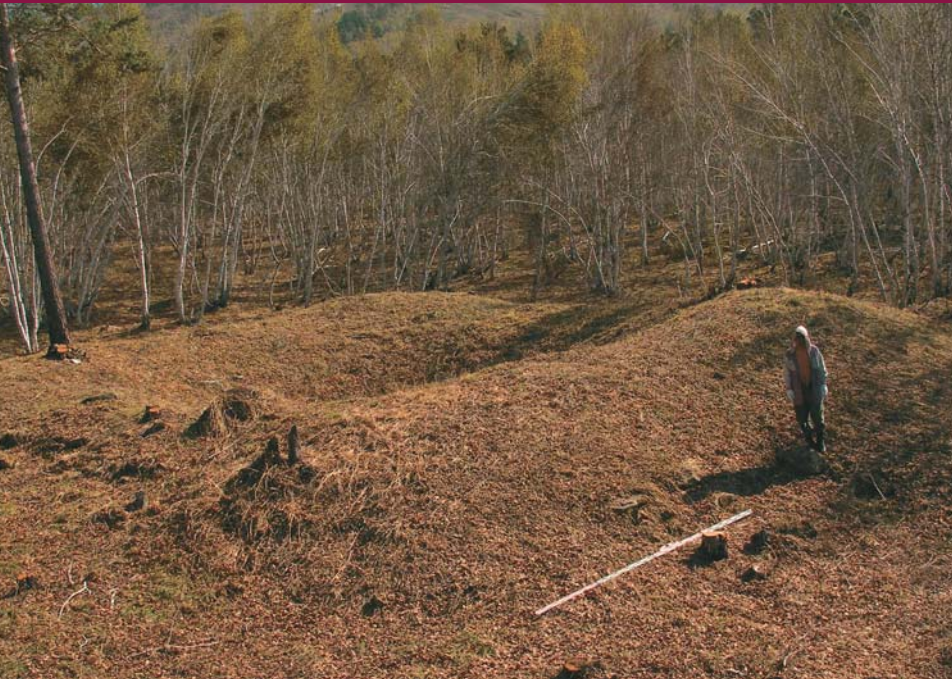
▲ Курган до начала раскопок, западина в центре — следы грабежа. Май 2006 г.