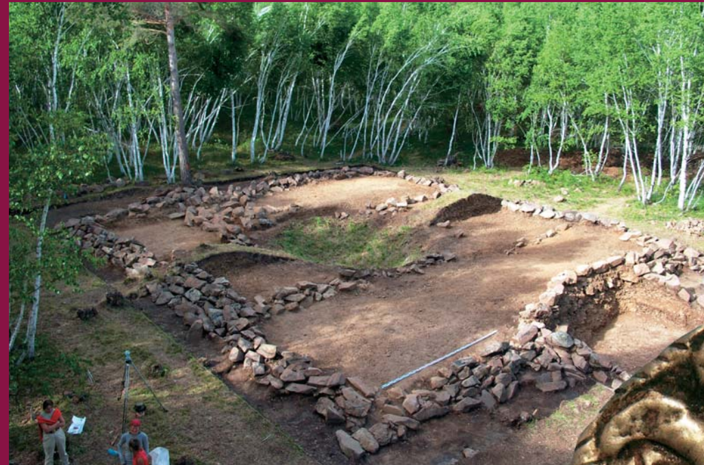
▲ Расчищены каменная четырехугольная крепида кургана и дромос — коридор, ведущий в погребальную камеру