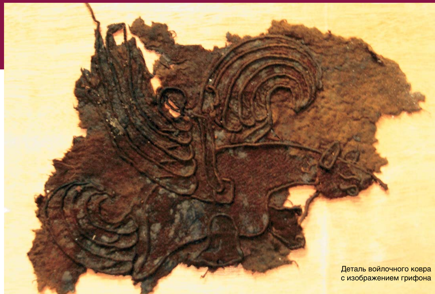
Деталь войлочного ковра с изображением грифона

В кургане оказалось пять перекрытий из камней, каждое из которых требовалось тщательно зачистить,