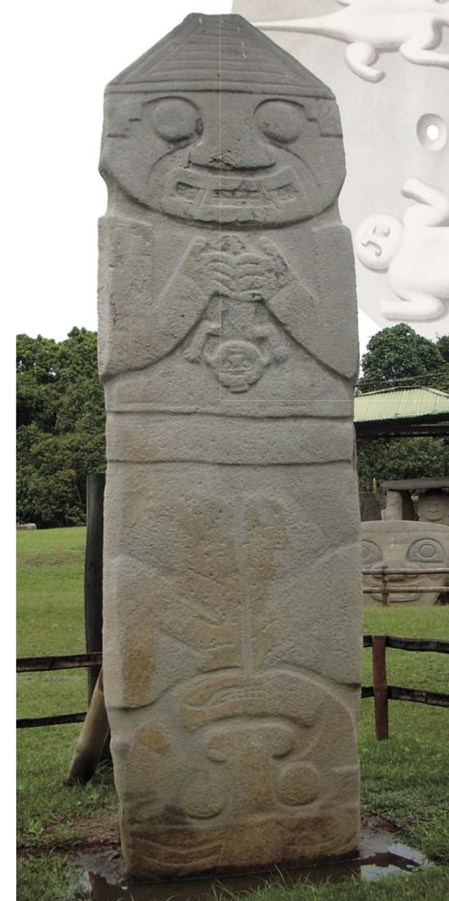
Пятиметровая каменная стела, изображающая звероподобное существо с ребенком в руках. По мнению одних специалистов, это изображение принятия родов, по мнению других – иллюстрация жертвоприношения детей, которые практиковали в Сан-Агустине. Археологический парк Сан-Агустин.