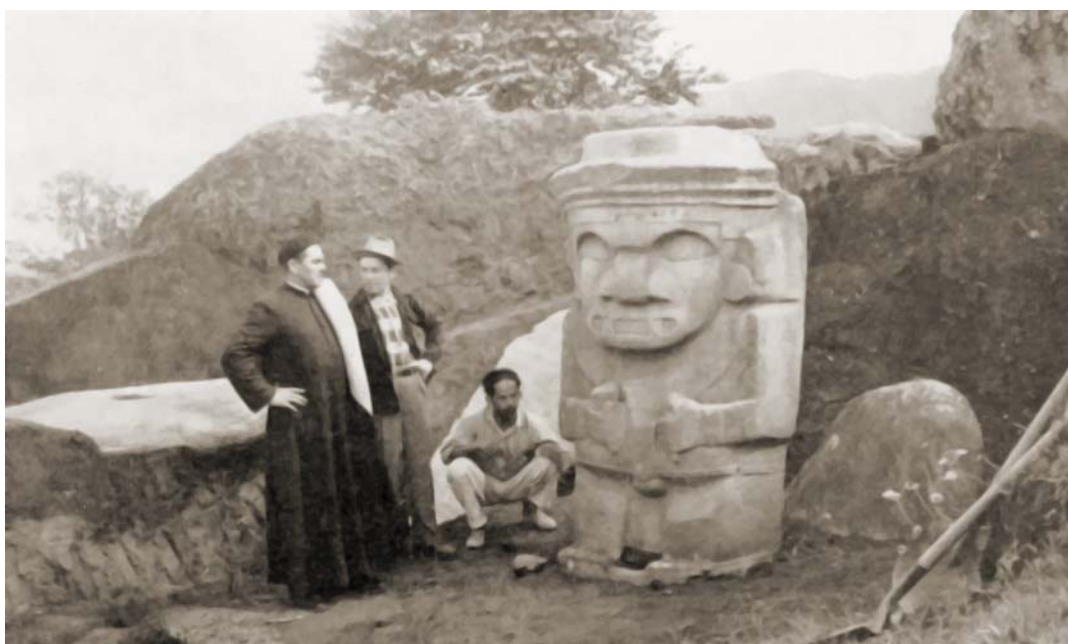
Каменное изваяние антропоморфного существа с клыками ягуара. Одна из первых статуй, раскопанных К. Т. Пройссом в 1913—1914 гг. По: (Duque G. L. San Agustín. Reseña Arqueológica. Bogotá: Imprenta Nacional, 1963 ). Университет дель Бадье (г. Кали, Колумбия)

и гробницы составляли единый ансамбль, строившийся по определенному плану: статуи, изваяния и каменные гробницы расположены не хаотично, для них подготавливались площадки, делались насыпи. Каменные гробницы ориентированы по сторонам света, на монументах сохранились следы краски, из чего можно сделать вывод, что скульптуры были выдержаны в одном стиле и в одной цветовой гамме. Строительством руководили опытные «инженеры», в возведении монументов участвовали мастера-каменщики, многотонные каменные блоки перемещались с помощью специальных приспособлений, в работах были задействованы сотни человек.