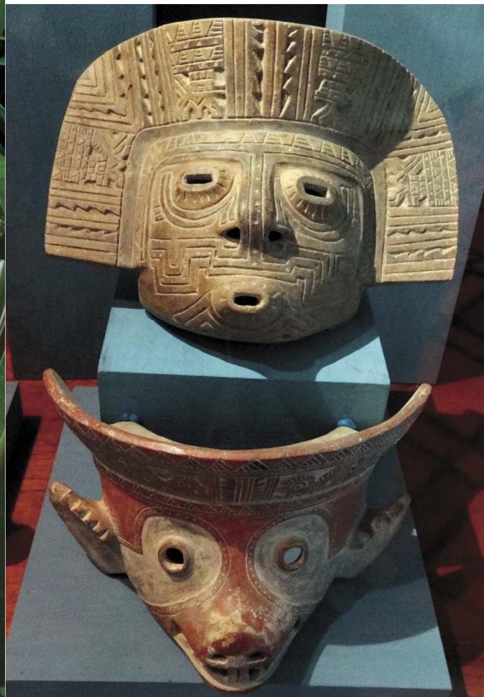
Керамические погребальные маски, культура малагана, датируются 200 г. до н.э.— 200 г. н.э.

На территории Колумбии этнографы и археологи прослеживают возникновение и эволюцию оригинальных социальных феноменов – вождеств, которые сочетают в своей структуре признаки предгосударственных образований