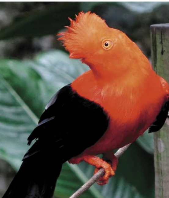
Андский скальный петушок

За устаревшим стереотипом восприятия Колумбии как территории разгула наркомафии и преступности существует и динамично развивается одна из наиболее «здоровых» экономик континента.