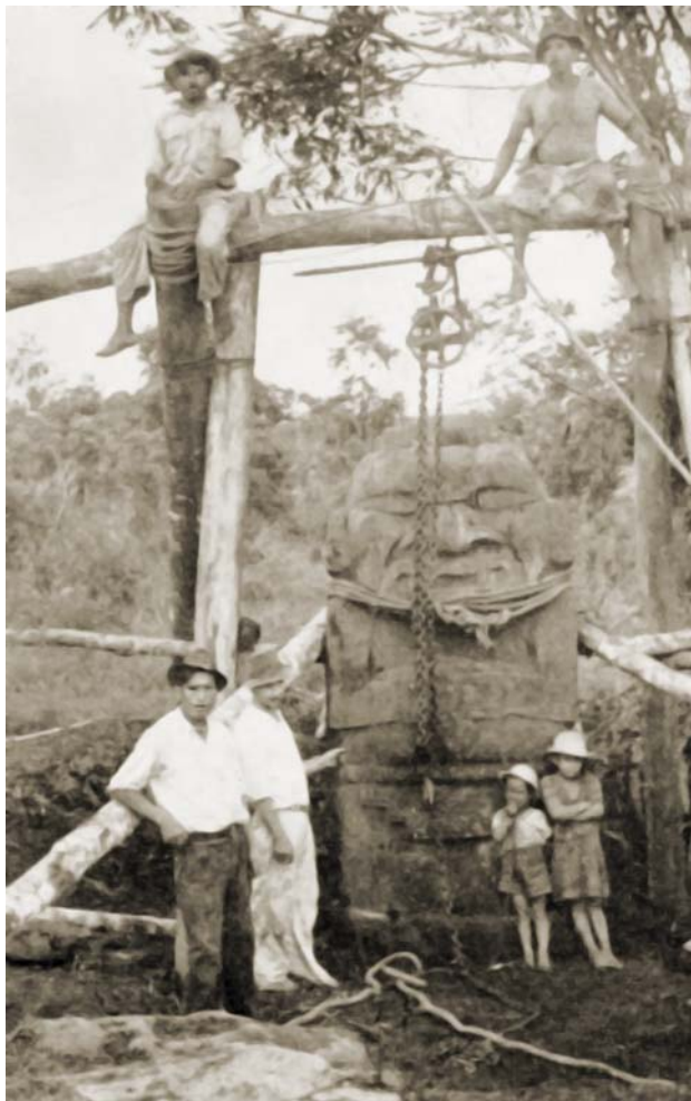
Статуя ягуароподобного божества, раскопанная К. Т. Пройссом в 1913—1914 гг. По: (Preuss K. T. Arte Monumental Prehistorico. Bogotá: Dirección de Divulgación Cultural de La Universidad Nacional De Colombia, 1931 )

Галерея персонажей Сан-Агустина – это целая мифологическая энциклопедия. Шаманы, воины, касики, птицы, обезьяны, змеи, лягушки, насекомые, на многих изображениях детально прослеживаются элементы одежды, украшений, головные уборы. Часто встречаются ягуароподобные черты (клыки, когти), расширенные зрачки (возможно, действие галлюциногенов), тела младенцев в руках (предположительно, каннибализм или жертвоприношения). Можно лишь догадываться, сколь сложные церемонии и ритуалы совершались в Сан-Агустине.