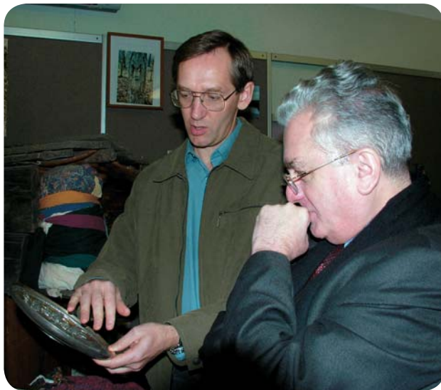
Директор Государственного Эрмитажа М. Б. Пиотровский (справа) в музее Института археологии и этнографии СО РАН.