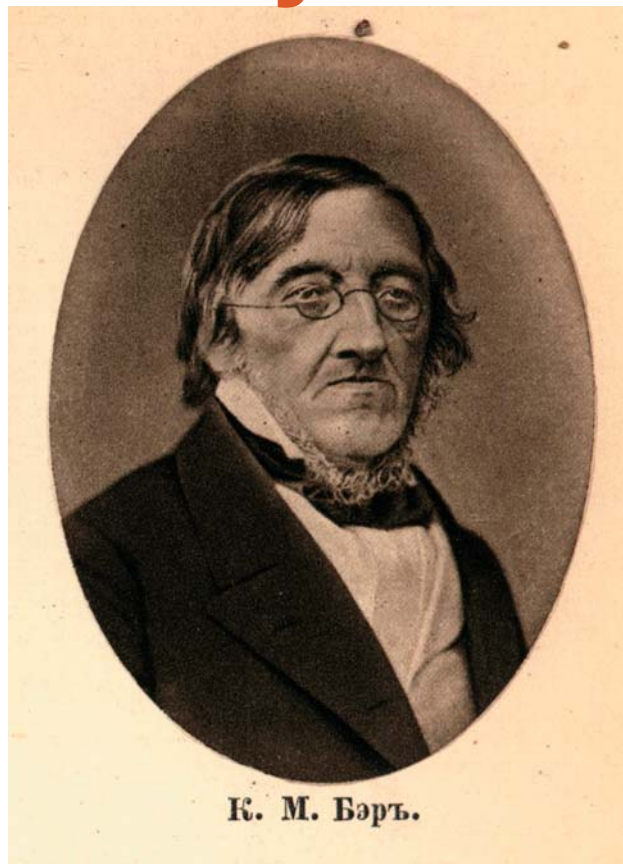
К. М. Бэръ.