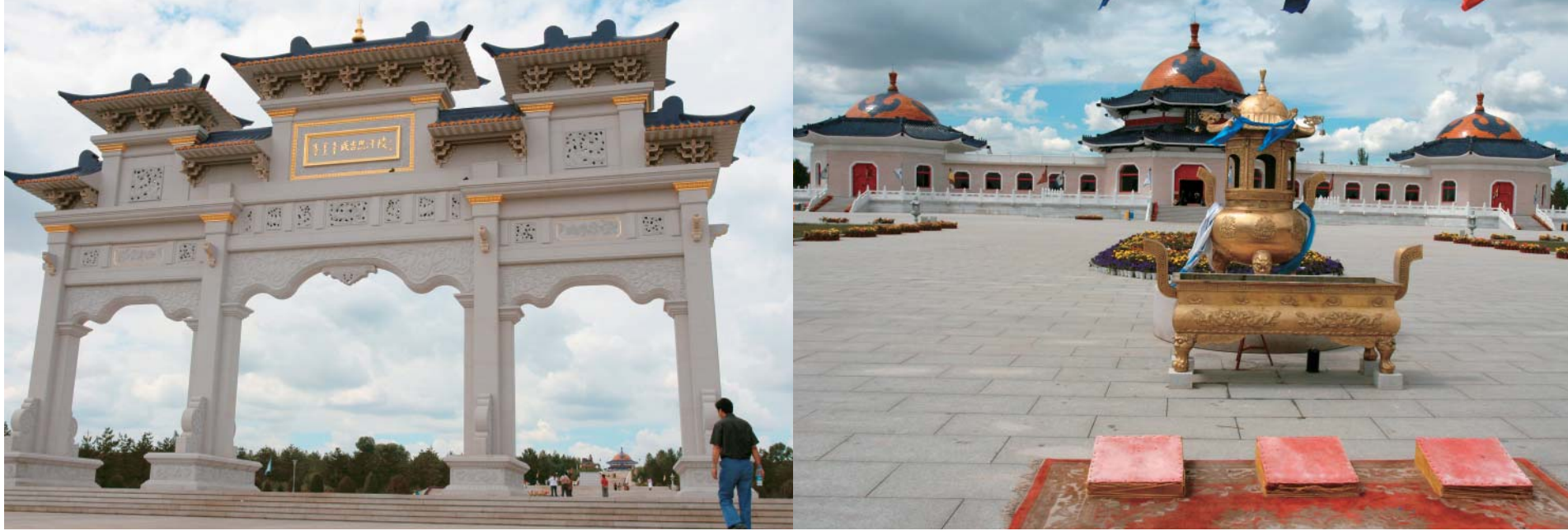
Центральный вход в мемориальный комплекс

Культ Чингис-хана, или «культ восьми белых юрт», был учрежден в Китае его внуком Хубилаем почти 750 лет назад