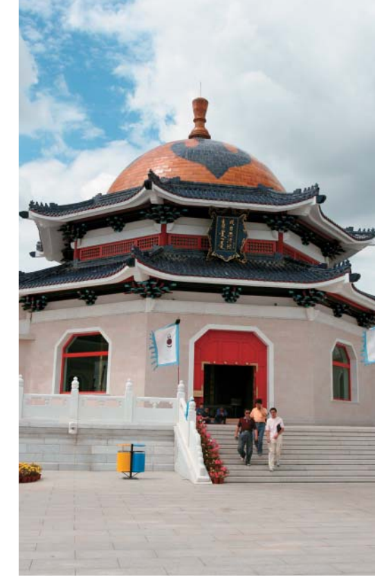
Центральная часть онгона Чингис-хана — места поклонения великому предку

Современный мемориальный комплекс Чингис-хана в Эджэн-Хоро (КНР). Первоначально мемориал представлял собой восемь белых юрт, каждая из которых была посвящена одному из великих предков — Чингисхану и его родственникам. В прошлом веке был выстроен новый комплекс, значительно расширенный в последние годы.