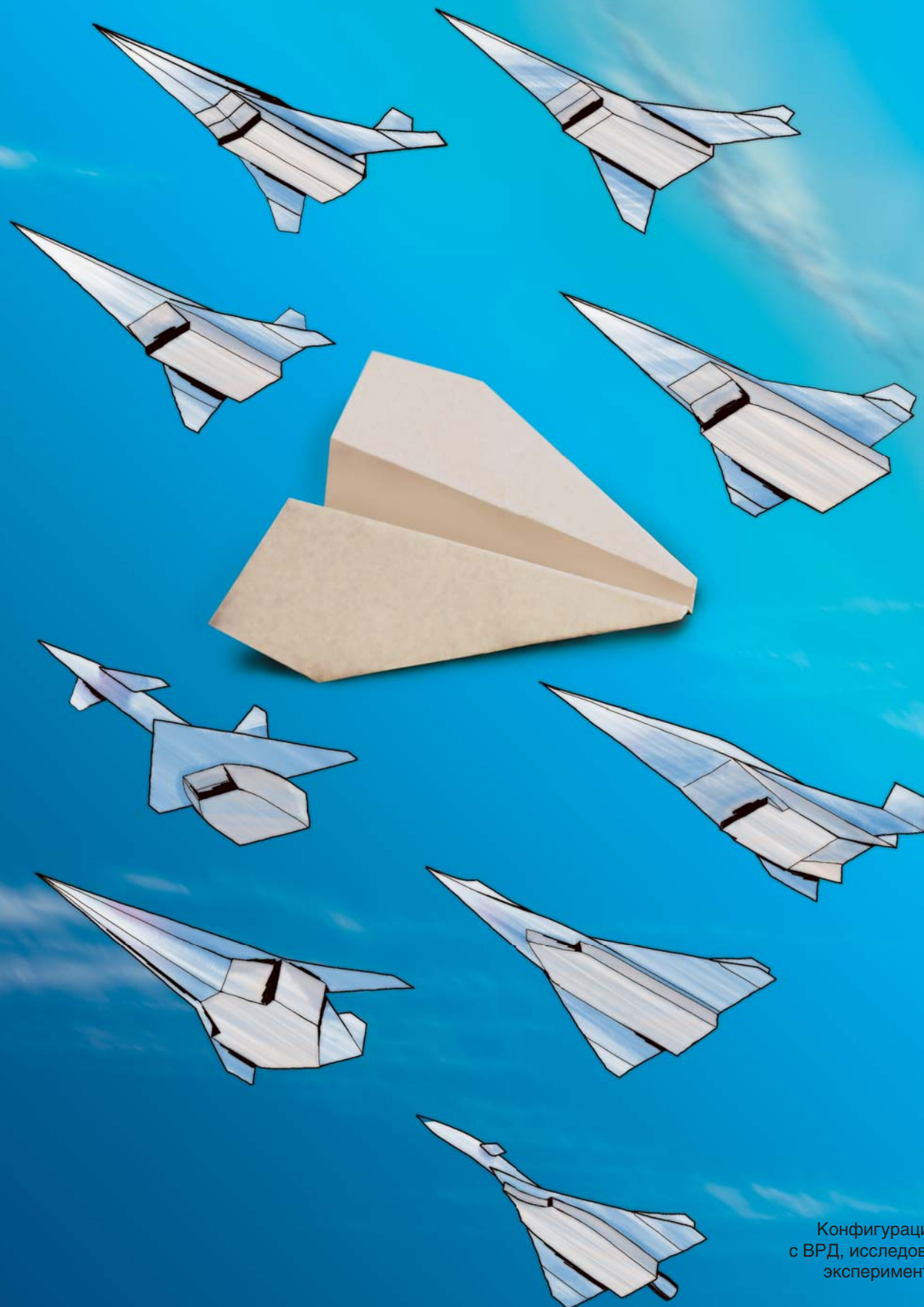
Конфигурации ГЛА с ВРД, исследованные экспериментально