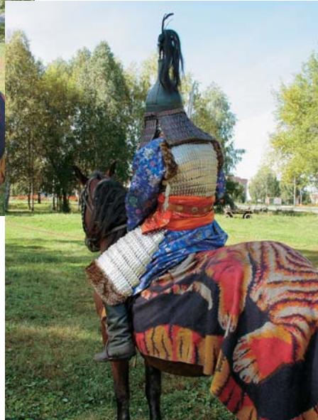
Реконструкция военного доспеха знатного ойратского тайши (племенного вождя) конца XVI — начала XVII вв. Он одет в ламеллярный доспех-«халат» и характерный клепаный шлем «кувшинообразной» формы. Автор реконструкции: Л. Бобров, выполнил — Ю. Филиппович

джунгарские правители реализовывали грандиозный эксперимент по созданию общества-гибрида, в котором традиционный кочевой образ жизни совмещался с элементами оседло-земледельческой культуры. Чтобы выжить, кочевые сообщества должны были приспособиться к меняющемуся политическому и экономическому «климату» на континенте. Из всех кочевых народов именно джунгарам это удалось в наибольшей степени.