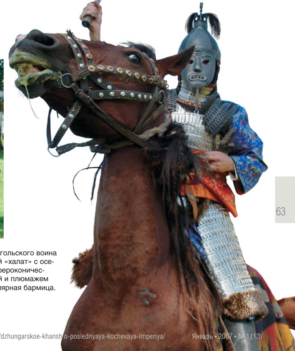
Реконструкция костюма знатного монгольского воина XVI—XVII вв.: доспех — ламеллярный «халат» с осевым разрезом и меховой опушкой, сфероцилиндрический шлем с железной маской-личиной и плюмажем из конского волоса, на шее — ламеллярная бармица. Палаш восточноазиатского образца. Автор реконструкции: Л. Бобров, выполнил Ю. Филиппович