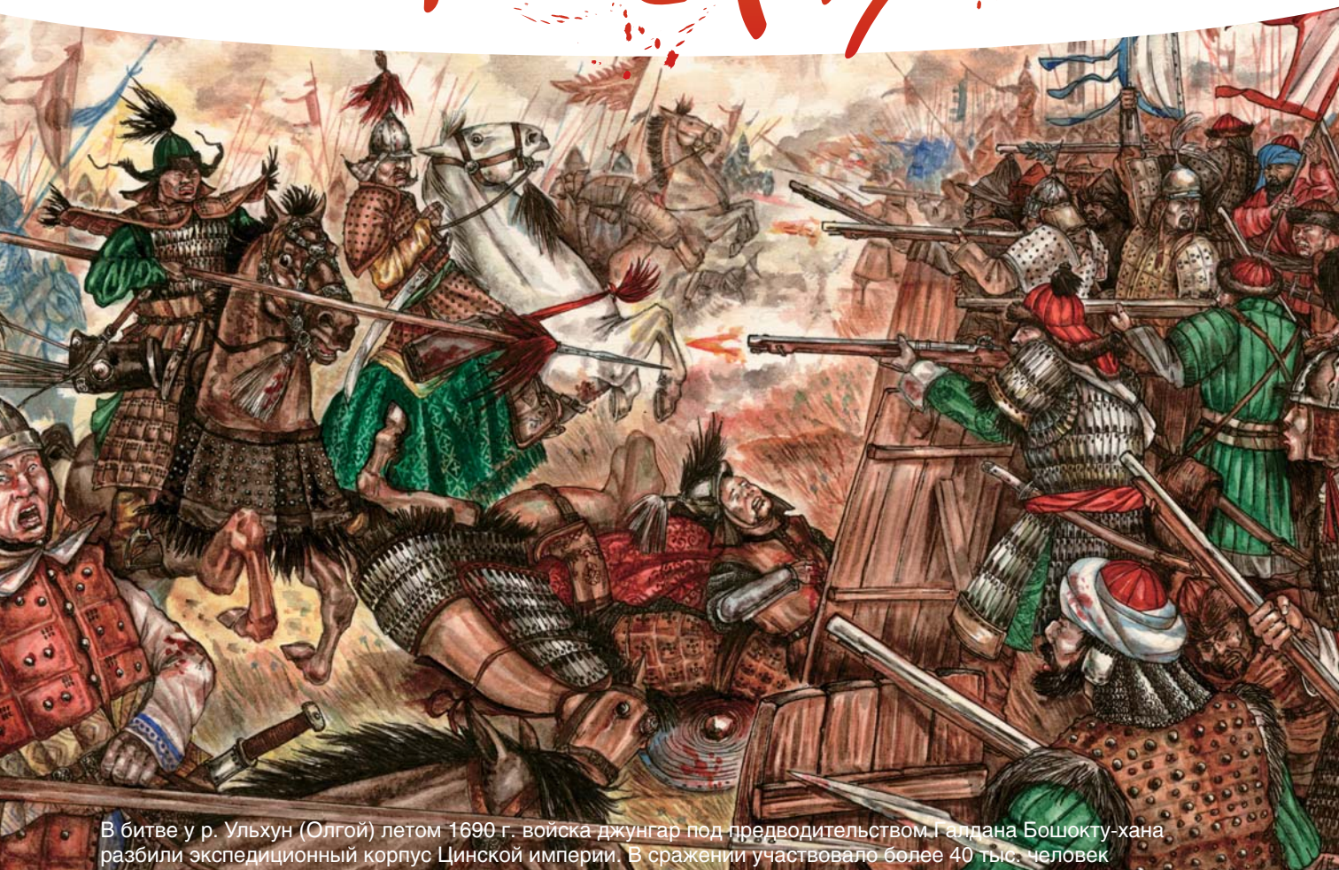
В битве у р. Ульхун (Олгой) летом 1690 г. войска джунгар под предводительством Галдана Бошукту-хана разбили экспедиционный корпус Цинской империи. В сражении участвовало более 40 тыс. человек