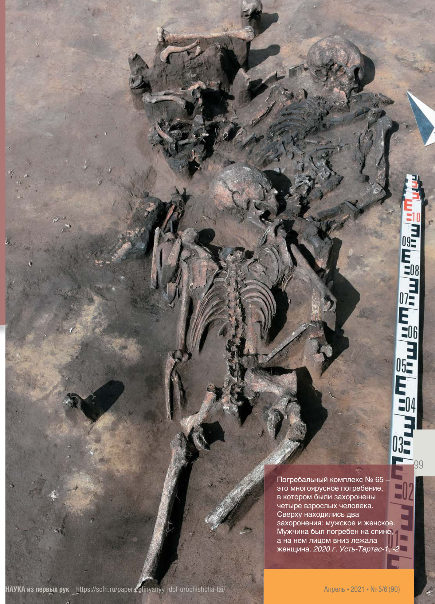
Погребальный комплекс № 65 – это многоярусное погребение, в котором были захоронены четыре взрослых человека. Сверху находились два захоронения: мужское и женское. Мужчина был погребен на спине, а на нем лицом вниз лежала женщина. 2020 г. Усть-Тартас-1, -2

Высота антропоморфа – 16,2 см, пол не выражен. Туловище вытянутое, прямое, без намеченной талии, руки длинные, почти до колен, при этом непроработанные; массивные кисти скорее напоминают лапы животного. Ноги непропорционально короткие с рельефно подчеркнутыми коленями и ступнями.