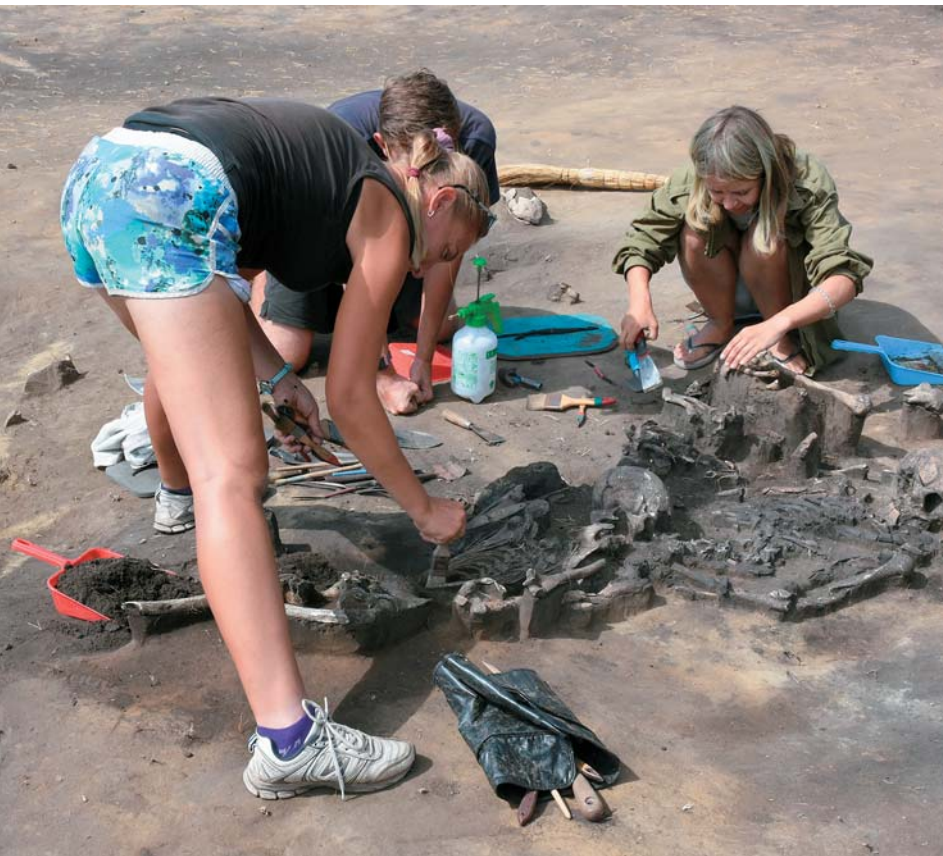
Расчистка погребального комплекса № 65

Очень неожиданным оказалось наличие полости, идущей вдоль всей передней части туловища скульптуры, которая явно служила емкостью. Однако из всего содержимого этого вместилища сохранилась лишь тонкая бронзовая пластинка; остальное, вероятно, было органического происхождения и не дошло до наших дней. Впрочем, мы собрали находящуюся там землю, с которой сейчас работают химики.