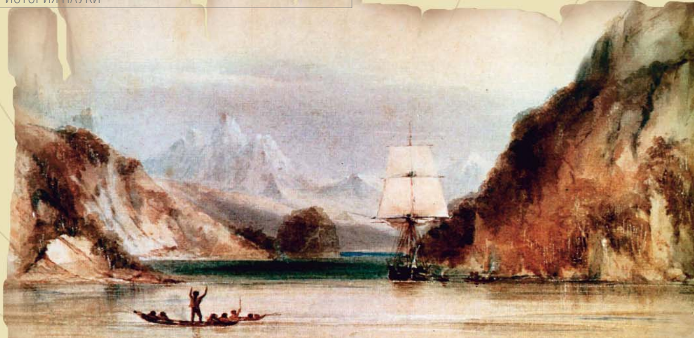
«Бигль» в проливе Мюррея

коз тебе, ни бананов, а вместо доброго друга Пятницы злобные огнеземельцы. И то верно: в таком месте даже у милейшего человека безнадежно портится характер.