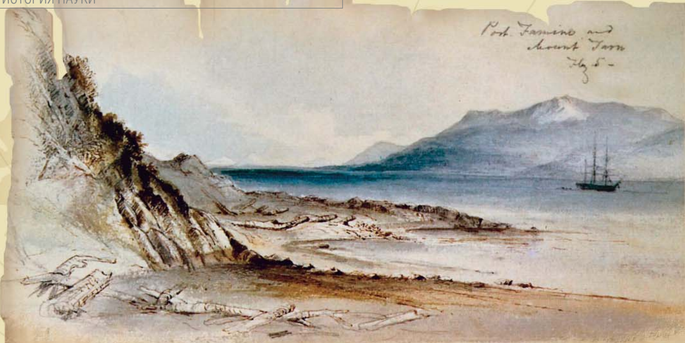
Порт Голода, где застрелился капитан Стокс

ему отдать приказ, чтобы из трупа бедняги приготовили скелет для «будущих исследований». Кто знает, может и по сей час этот скелет хранится в Лондоне в Музее естественной истории. (Музей, кстати, расположен недалеко от российского посольства, будете поблизости — поинтересуйтесь.)