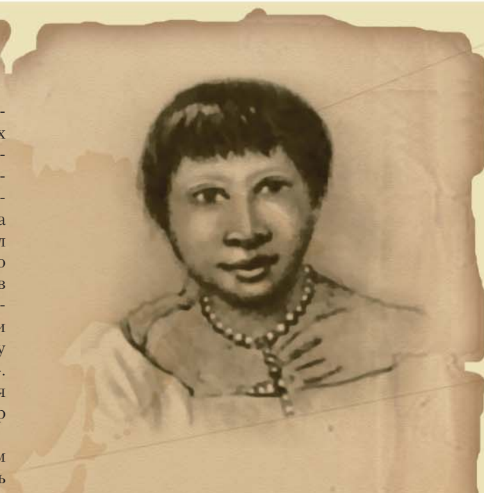
Фуэгия в 1833 г. Рис. Р. Фицроя

Корабль Его Величества «Бигль» вышел в свое историческое плавание 27 декабря 1831 года под ко-