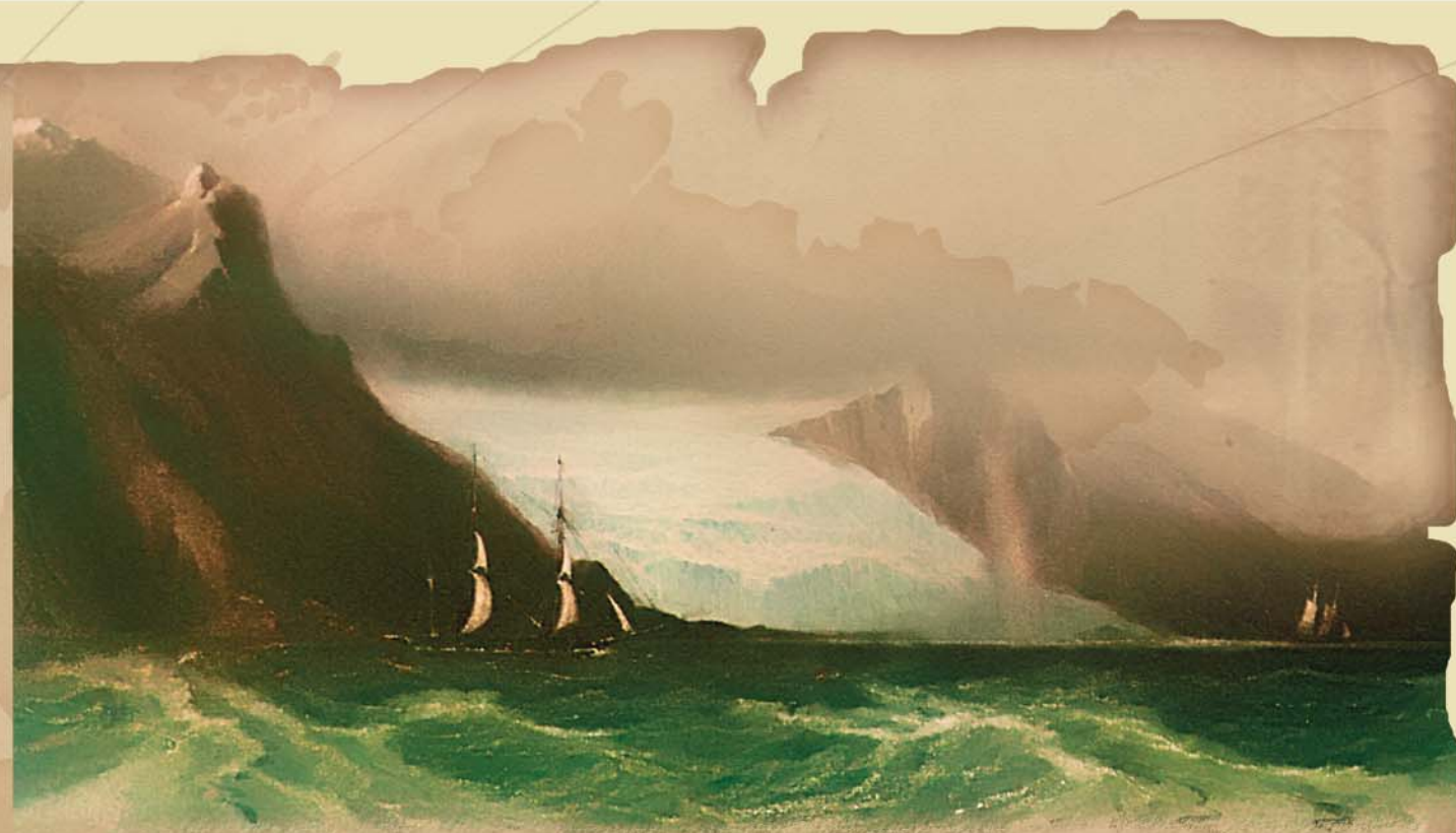
Вид на гору Сармиенте

Вот как описывает Дарвин это грустное возвращение. «5 марта мы бросили якорь в бухте Вулья, но не увидели там ни души. Вскоре мы увидели приближающийся челнок с развевающимся маленьким флагом; один из мужчин в нем смывал краску с лица. То был бедный Джемми, ныне худой, осунувшийся дикарь, с длинными всклокоченными волосами и голый, с одним лишь кус-