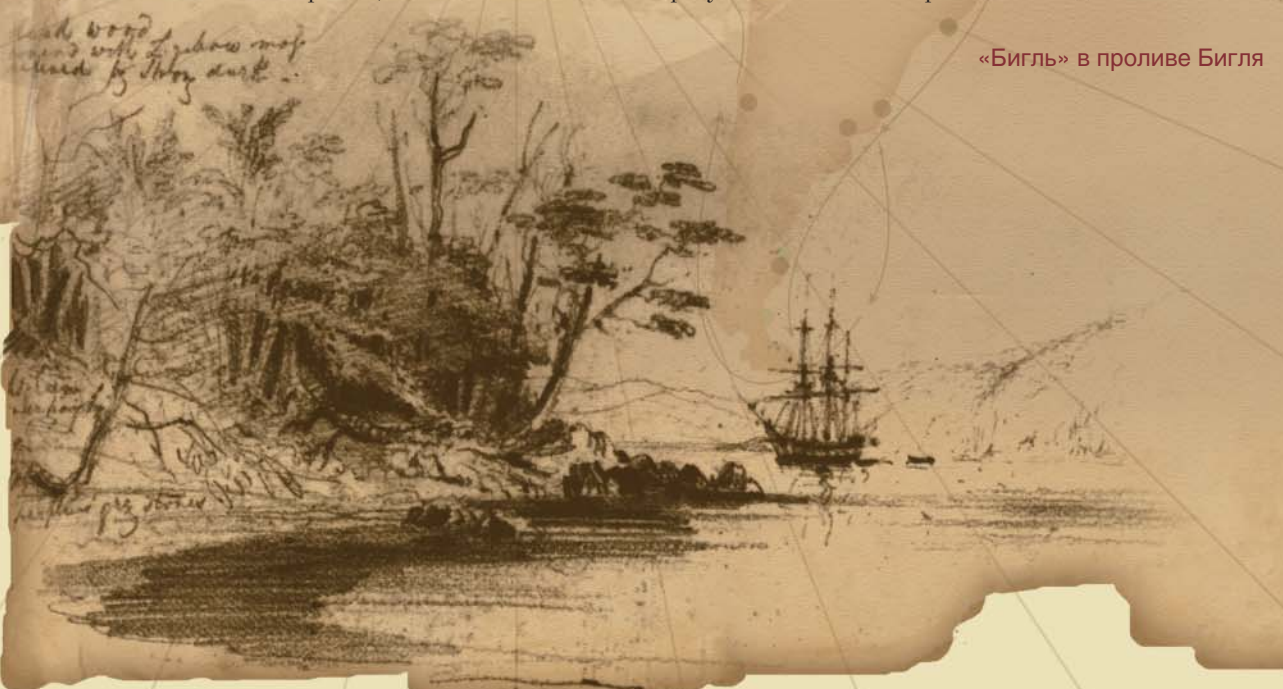
«Бигль» в проливе Бигля

и аргентинские генералы тоже подумывали повоювать из-за Огненной Земли, но потом просто поделили ее по меридиану. Генералы обошлись без всяких карт и остались очень довольны. (Да что там Огненную Землю, они на всякий случай и Антарктиду разделили! Аж до Южного полюса...)