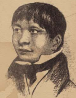
Джемми Баттон. Рис. Р. Фицроя

Бухта Ботафого в Рио-де-Жанейро, где жили Дарвин и Фуэгия