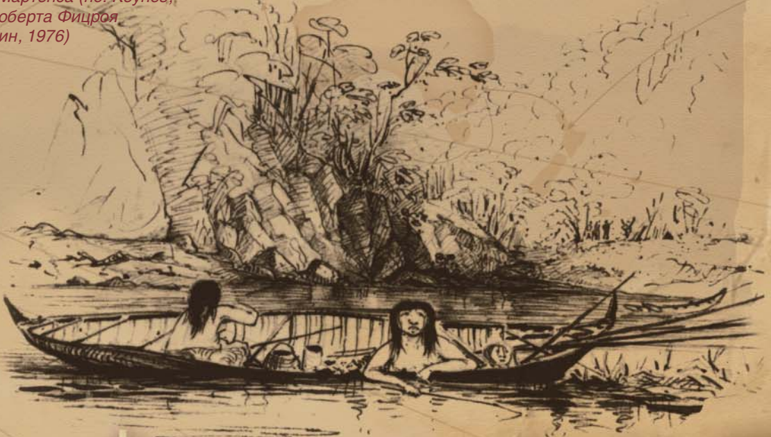
В статье использованы рисунки штатного художника «Бигля» Конрада Мартенса (по: Кейнес, 1979) и Роберта Фицроя (по: Дарвин, 1976)

истории, происходили давно, но герои ее не забыты. В бухте неподалеку от бывшего форпоста прогресса вырос городок Ушуя. В нем есть улицы, носящие имена Дарвина, Фицроя и Фуэгии Баскет.