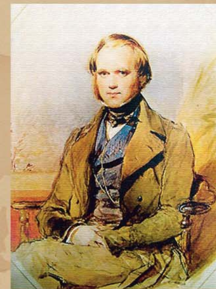
Ч. Дарвин в 1839 г. Худ. Джордж Ричмонд

Так закончился бал нашей Золушки-Фуэгии. В прошлом остались и прием у королевы, и поездки в карете по Лондону, и неспешные прогулки с Дарвином по Рио-де-Жанейро. Фуэгия помахала рукой капитану и оста-