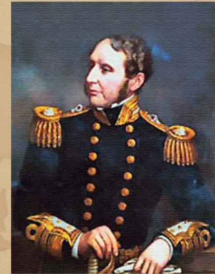
Р. Фицрой в 1865 г.

В одно прекрасное утро наши моряки проснулись на необитаемом острове и обнаружили, что их единственное плавсредство уплыло в неизвестном направлении. Они соорудили из веток корзину, обтянули ее парусиной и послали на этом суденышке гонцов на «Бигль». Глубоко за полночь добрались гонцы до корабля и доложили о происшествии разъярившемуся капитану. Фицрой немедленно снарядил спасательно-карательную экспедицию. В течение 18 суток, следовавших за этой бурной ночью, моряки занимались поисками вельбота.