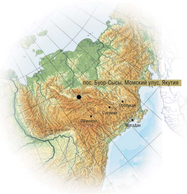
пос. Буор-Сысы, Момский улус, Якутия