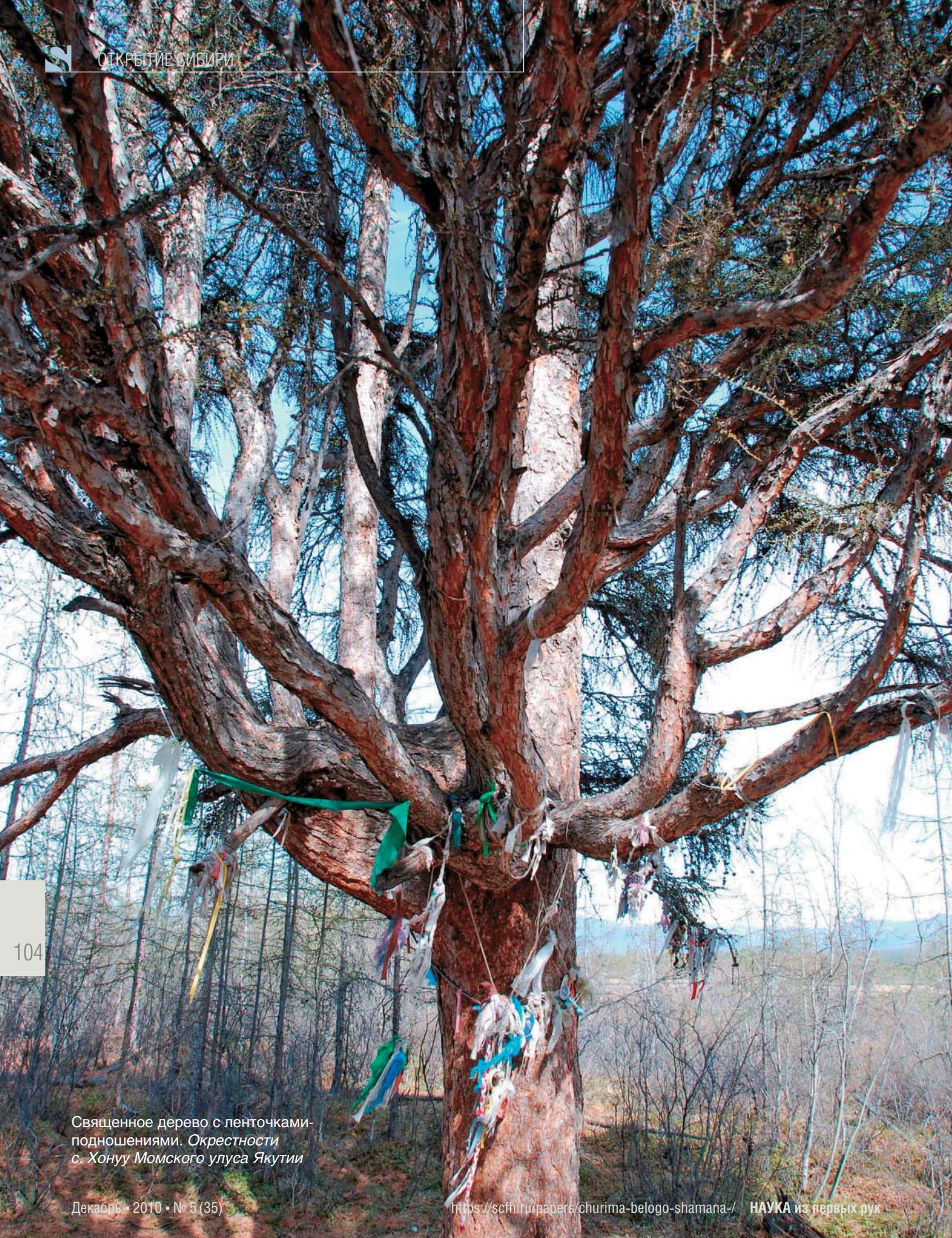
Священное дерево с ленточками-подношениями. Окрестности с. Хонуу Момского улуса Якутии