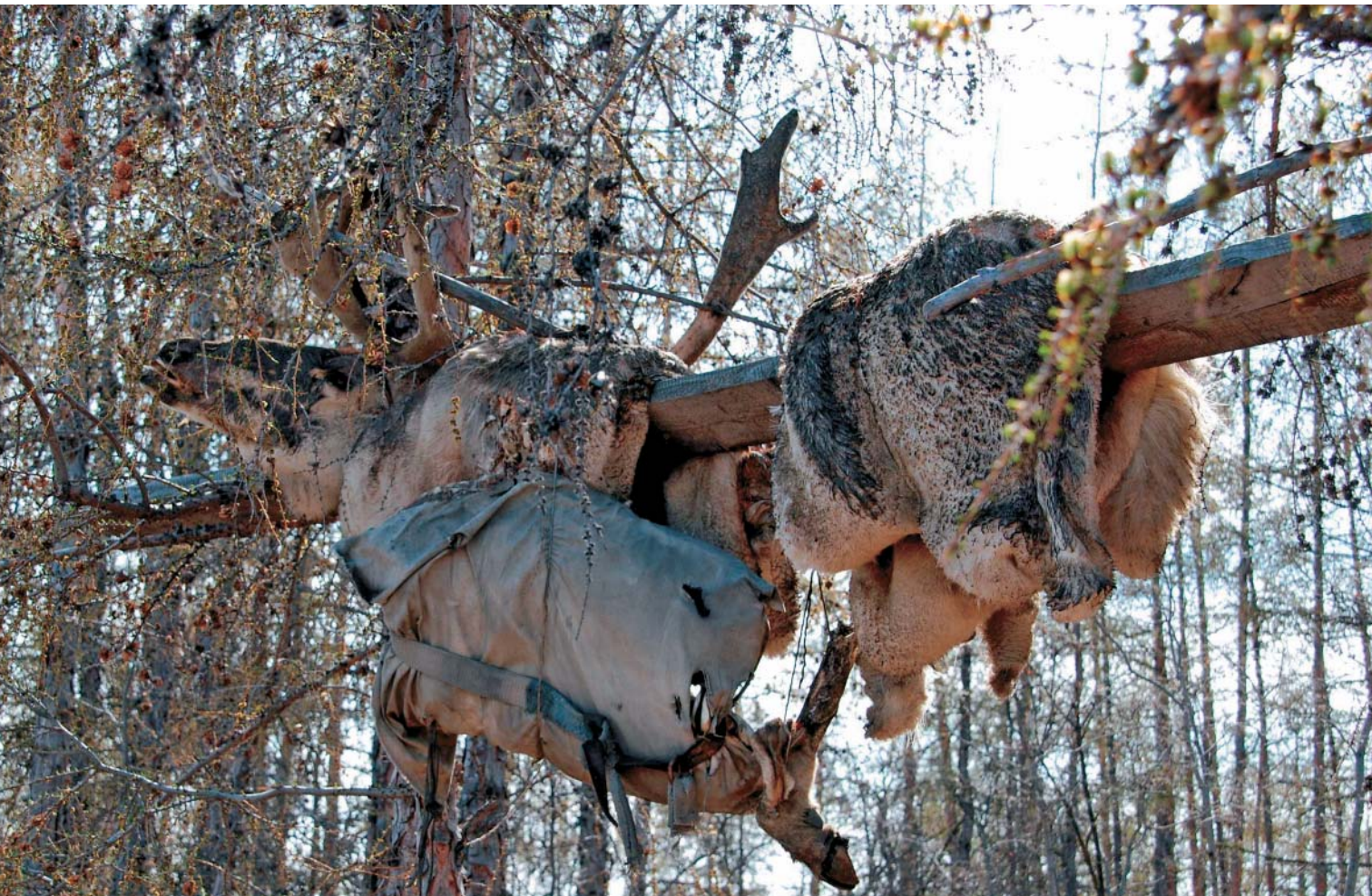
Останки жертвенного оленя, седло и вещи покойного эвена на кладбище с. Хонуу Момского улуса Якутии

Соляной диск и деревянная кукла эмэгэт – принадлежности шаманского костюма. Солнце освещало шаманке путь во время ее путешествия по сумрачному Нижнему миру, с помощью куклы она общалась с духами и остальными обитателями потустороннего мира. Краеведческий музей с. Хонуу Момского улуса Якутии