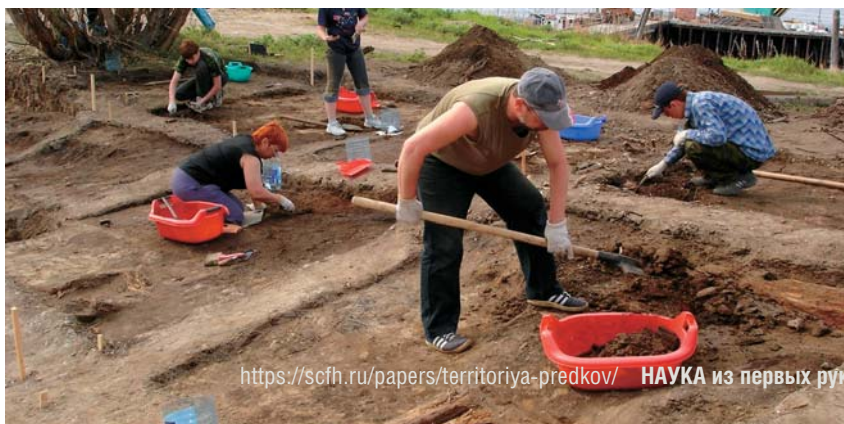
https://scfh.ru/papers/territoriya-predkov/ НАУКА из первых рук