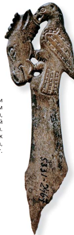
Фрагмент ложки с изображением хищной птицы, клюющей голову оленя. Рог. Из раскопок В. С. Адрианова, 1935—1936 гг.

по истории искусства. Им посвящены статьи, монографии, выставки. Казалось бы, мало что может удивить ученых... Тем не менее загадки Усть-Полуя продолжают ставить нас в тупик.