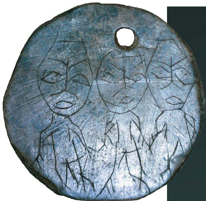
Бронзовая бляшка. Гравировкой нанесены изображения трех антропоморфных фигур. Из раскопок Н. В. Федоровой, 2006 г.

полуострова Ямал. Оно представляет собой пронизку (украшение с основой в виде полой трубочки, в которую продевается кожаный ремешок), отлитую из белой оловянистой бронзы и имеет вид сидящего человекоподобного существа, изображенного в профиль. На спине у существа сидит пушной зверь, в руках оно держит еще одного зверя. Голова антропоморфа довольно крупная, на ней – шлемовидный головной убор, глаза имеют миндалевидную форму с двойным контуром, на талии – пояс в виде жгута. На уровне колен – еще один жгут.