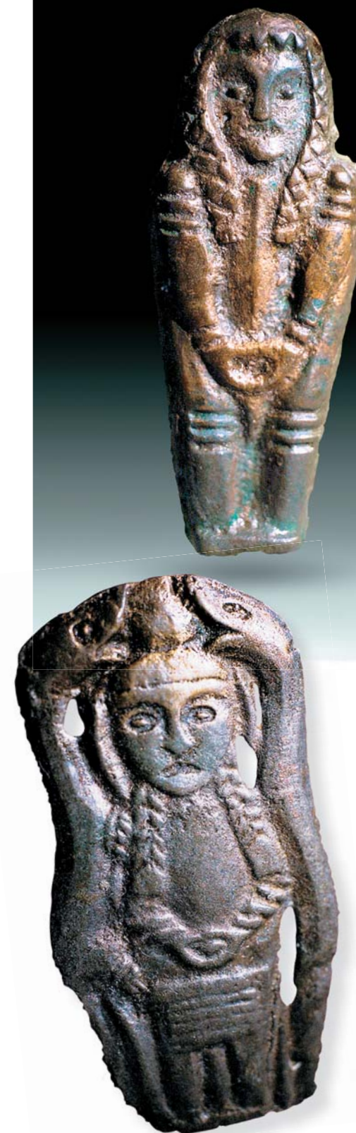
Антропоморфные фигурки. Бронза. Холмогорская коллекция.

Наверно, если бы в Усть-Полюе нашли плоское костяное изображение стоящей анфас фигуры человека со всеми характерными для здешних находок признаками, никто бы особенно не удивился. Необычно, что оно вырезано из кости, а не отлито из бронзы, но в общем – выглядело бы вполне типично. Уникальность усть-полуйского человека в том, что, во-первых, – это трехмерная, вполне реалистичная скульптура, не соответствующая стилю западно-сибирских таежных мастеров ни в древности, ни в период этнографической современности. Во-вторых, поза фигуры – сидячая, с поджатыми к животу ногами – в раннем железном веке не встречается. Хотя известны средневековые бронзовые изображения сидящего существа. Одно из них найдено в Предуралье, в Чердынском районе и представляет собой фантастический персонаж: человекоподобное существо с птичьей головой. Второе происходит из средневекового могильника на юге