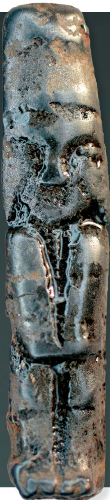
Подвеска в виде антропоморфной фигуры с птицей над головой. Из раскопок Н. В. Федоровой, 2006 г.

полей, либо в захоронениях посмертных изображений умерших – так называемых иттарма. Причем поза иттарма имитирует реальную позу погребенных, что обнаружилось при анализе погребального обряда могильника у пос. Зеленый Яр. В этом же некрополе мы наблюдаем связывание умерших ремешками на уровне плеч, груди, колен, ступней. Также уместно вспомнить пронизку-антропоморфа из могильника на юге Ямала с изображением жгута на уровне колен фигурки.