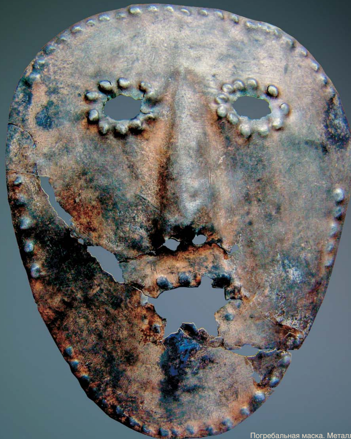
Погребальная маска. Металл. Найдена в Прикамье

Рассматривая в археологическом материале аналогии найденному предмету, особенно если речь идет о произведении древнего или средневекового искусства, мы можем более или менее точно ответить на два вопроса: когда вещь сделана, и к какому культурному кругу она принадлежит. Чтобы определить ее назначение, проанализировать семантику образа, высказать предположения об этнической принадлежности изготовителей и пользователей вещи, необходим сравнительный анализ с привлечением фактов из других регионов и времен.