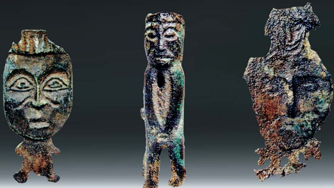
Антропоморфные изображения (фигурка и личины). Бронза. Из раскопок В. С. Адрианова, 1935—1936 гг.