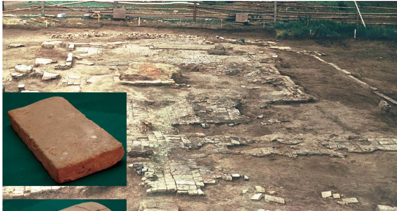
Раскопки здания времен Монгольской империи близ с. Нарсатуй (Мухоршибирский р-н, Республика Бурятия). Гранитные плиты — остатки опор деревянных колонн-столбов, поддерживавших кровлю, полы выложены из кирпича. На середине здания видны остатки квадратного очага, по периметру — остатки кирпичной стенки. При строительстве использовались как обожженные, так и сырцовые кирпичи, большое количество черепицы, причем наиболее украшенными были концевые черепицы, служившие декоративным украшением всего здания

нить под своими знаменами практически все население монгольских степей. Вот тут-то и появлялась настоящая загадка для ученых — кочевые империи, которые могли оказывать и оказывали влияние на ход мировых исторических процессов. По мнению большинства современных исследователей, такого уровня достигали политические образования хунну, сяньби, жуэнь, тюрок, уйгуров, киданей и, конечно, монголов.