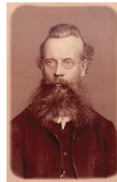
Исследователь Сибири, археолог, этнограф, публицист и общественный деятель Н. М. Ядринцев. Он возглавлял экспедицию Восточно-Сибирского отдела Русского географического общества, которая нашла в Северной Монголии в долине р. Орхон развалины знаменитого Каракорума — столицы Монгольской империи.