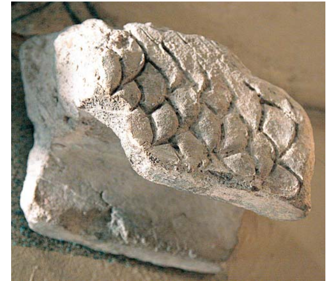
Остатки терракотового дракона — украшения кровли здания. Раскопки близ с. Нарсатуй. Мухоршибирский р-н, Республика Бурятия