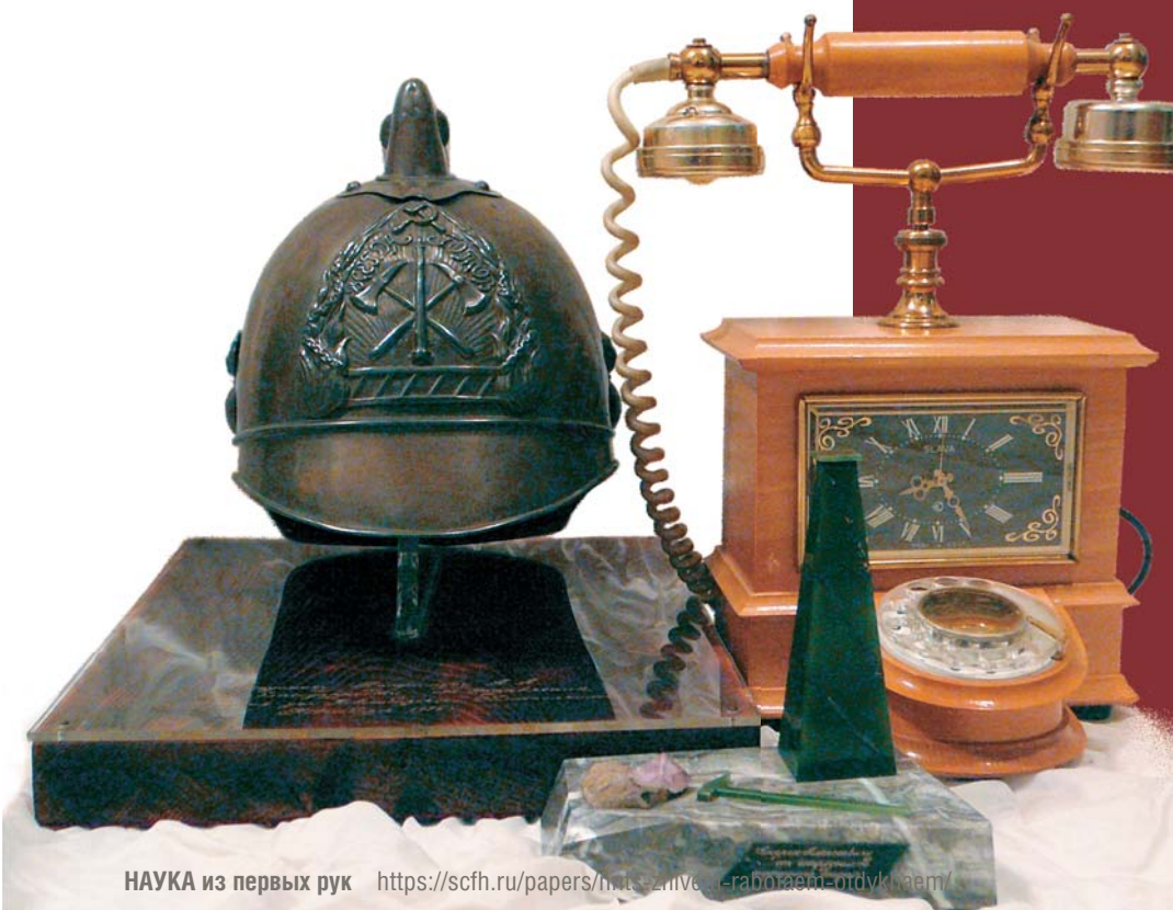
Личные вещи академика А. А. Трофимука