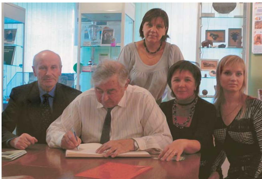
Академик Г. И. Марчук с коллективом Музея СО РАН. Октябрь 2008 г.

На этой большой выставке Новосибирский научный центр показан как исторически первый на востоке страны и один из крупнейших в России комплекс научных, научно-технических и научно-вспомогательных учреждений, а также как объект производственно-жилищной и социально-бытовой инфраструктуры. Цель выставки — научно-экспозиционное и информационное представление особенностей ННЦ, исторических традиций и современных новаций, популяризация достижений Сибирского отделения, пропаганда здорового образа жизни.