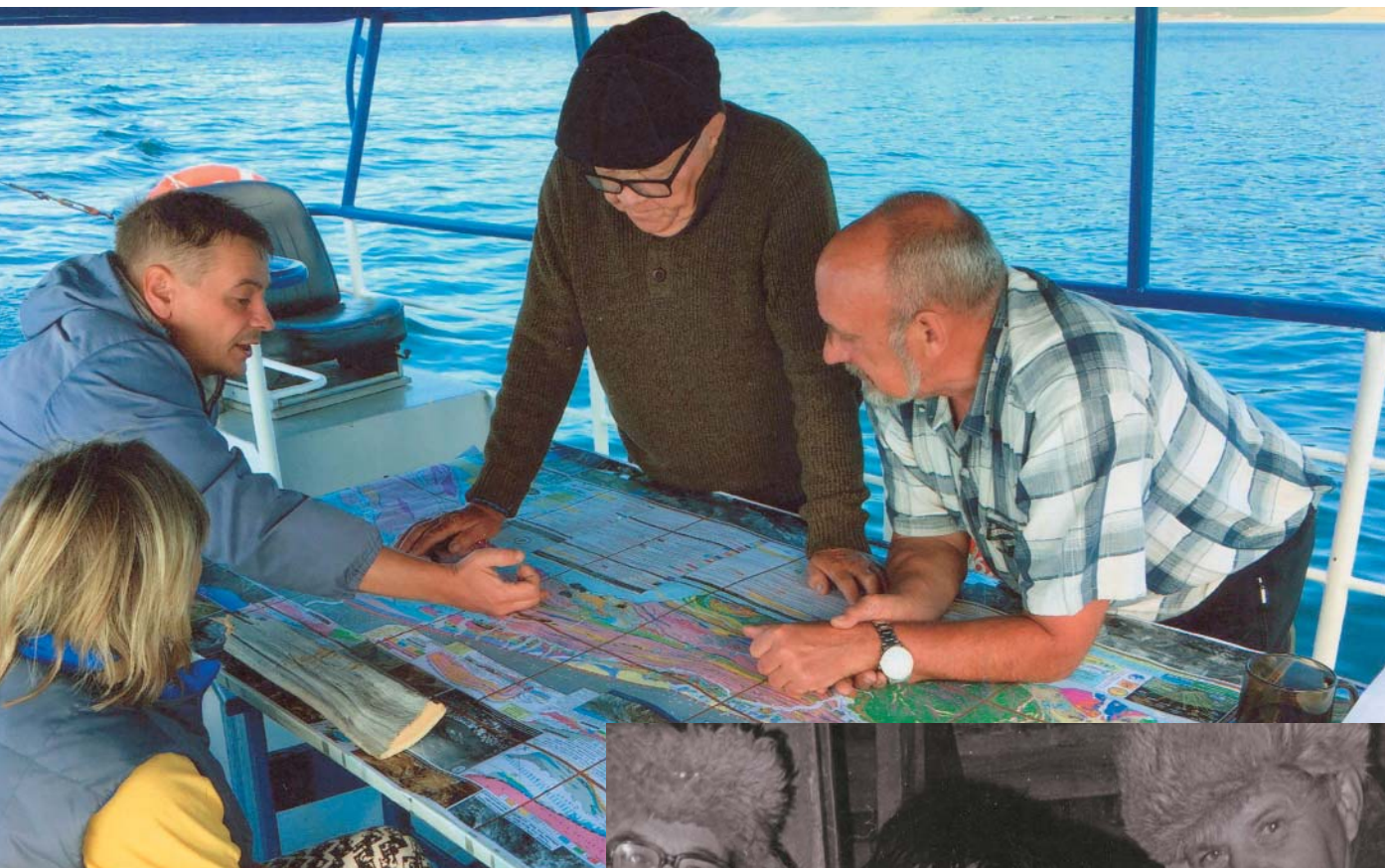
Любовь к Байкалу академик Добрецов хранил всю жизнь. Справа – байкальские сиги. 1983 г.