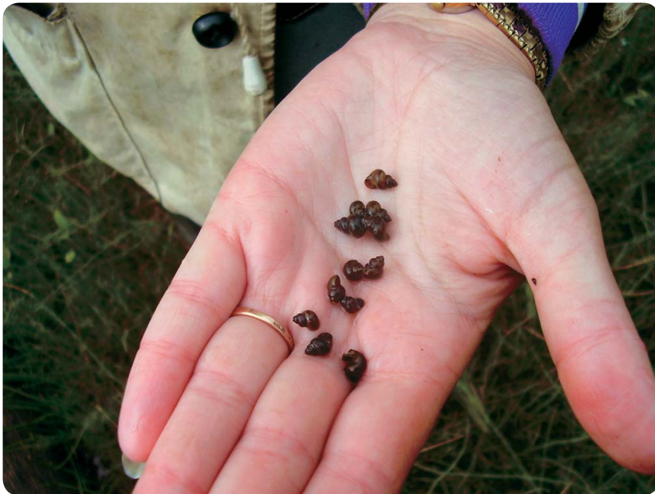
Переднежаберные моллюски рода Codiella — первые промежуточные хозяева O. felineus .

из них — O. felineus , M. bilis , O. longissimus — окончательными хозяевами могут быть млекопитающие, а остальные паразитируют на хищных и водоплавающих птицах (Карпенко, Федоров, 1976; Федоров, 1975, 1979; Юрлова, 1979). Долгое время считалось, что угрозу для людей представляет лишь один вид — O. felineus , хотя возможность заражения человека другими видами трематод (прежде всего меторхами, также принадлежащими к семейству описторхид) допускалась многими исследователями (Скрябин, 1950; Федоров и др., 1970; Сидоров, Белякова, 1972).