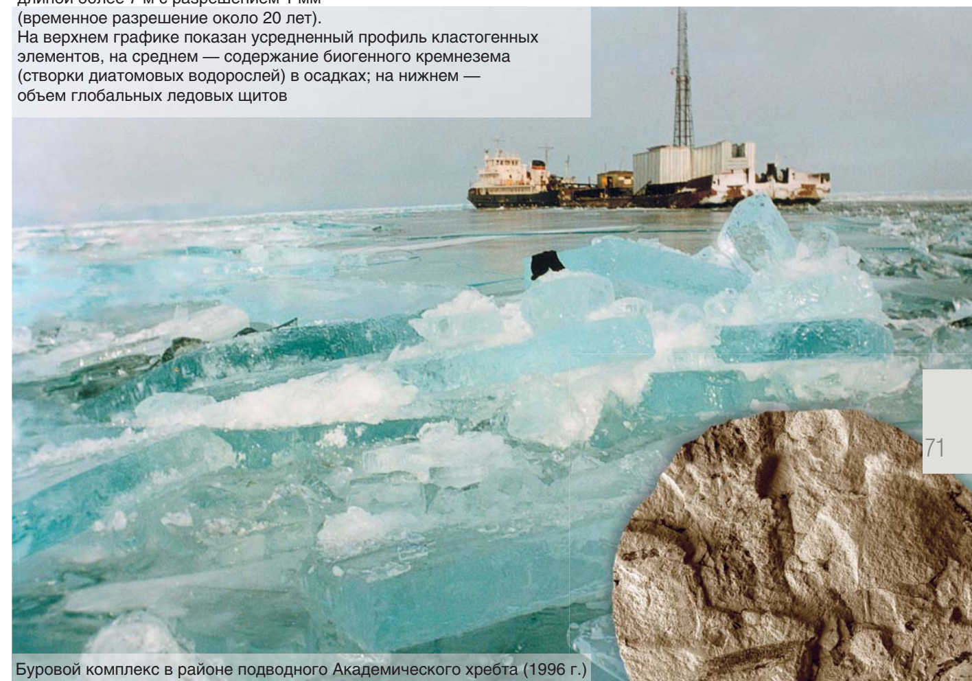
Буровой комплекс в районе подводного Академического хребта (1996 г.)

ный 10–50 годам, т.е. почти в сто раз быстрее, чем при современном потеплении! Относительно теплый период продолжался 400–1000 лет, а затем температура быстро возвращалась к «ледниковому» уровню. За 60 тыс. лет такие события происходили здесь как минимум 19 раз. В последние годы следы данных климатических аномалий были обнаружены во многих частях Северного полушария, причем они были асинхронны подобным событиям, имевшим место в Южном полушарии.