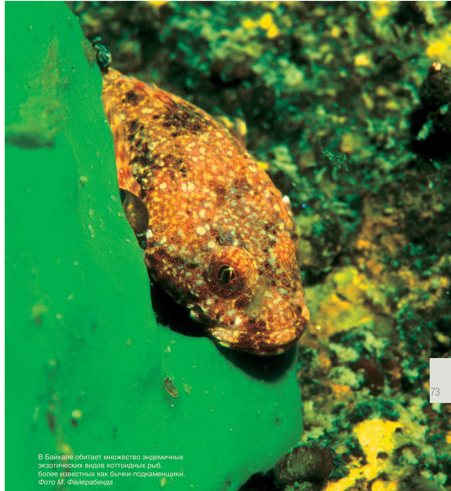
В Байкале обитает множество эндемичных экзотических видов коттоидных рыб, более известных как бычки-подкаменщики.