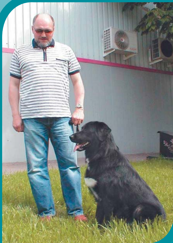
Тыргак с хозяином на выставке.

в Москве в 2001 году и затем неоднократно выставлялась на выставках Союза кинологических организаций России. 5 собак получили оценки «отлично». Привезенный из Монгун-Тайгинского кожууна (района) кобель по кличке Мугур (сейчас ему 5 лет) признан чемпионом России.