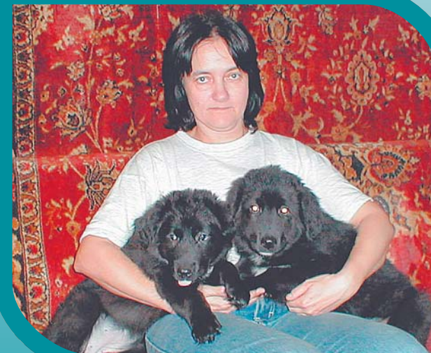
Щенки Тыргак и Майнак.

к местным условиям пастушеско-сторожевые собаки всегда будут там необходимы.