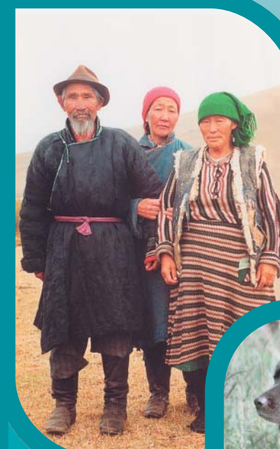
Животноводы, у которых рос Мугур, будущий чемпион России.

ЗАХАРОВ Илья Артемьевич — доктор биологических наук, член-корреспондент РАН, с 1992 г. заместитель директора Института общей генетики РАН, профессор МГУ. Автор около 200 статей и 12 книг. Область научных интересов — генетика животных, эволюционная генетика, история генетики