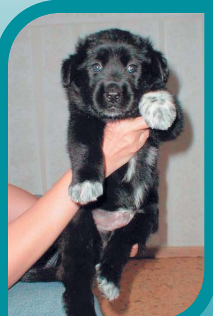
Первые московские «дети».

ЗАХАРОВ Илья Артемьевич — доктор биологических наук, член-корреспондент РАН, с 1992 г. заместитель директора Института общей генетики РАН, профессор МГУ. Автор около 200 статей и 12 книг. Область научных интересов — генетика животных, эволюционная генетика, история генетики