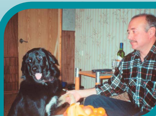
Мугур с хозяином в Москве.

они сейчас почти исчезли, было вызвано несколькими причинами. Первая и главная — безразличие: нам не удалось встретить ни одного любителя, который бы сознательно занимался разведением тувинских собак... Наконец, распространение ядов, которые разбрасывают для уничтожения расплодившихся (в отсутствие собак!) волков. (Кстати, местные жители во время одной из поездок показывали нам тувинскую овчарку, которая храбро вступила в поединок с волком и загрызла его).