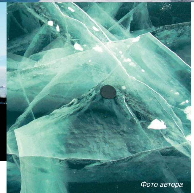
Становая трещина, проходящая через Байкал: ее образование сопровождается такими же динамическими эффектами, как и при землетрясении