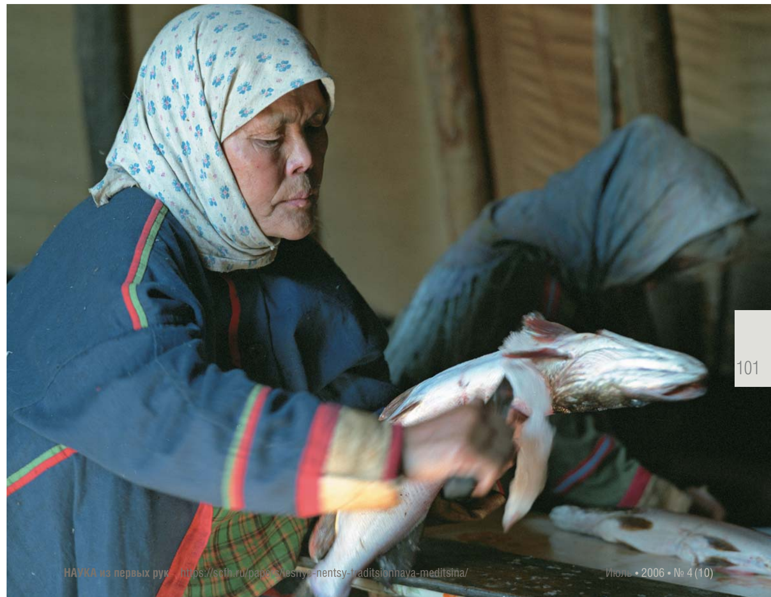
● Проверка рыболовных снастей Женщина разделывает рыбу. Стойбище Воен-то

При простуде или болезнях суставов лесные ненцы прикладывали к груди, спине, суставам компрессы из прокаленного песка, насыпанного в мешочек. При