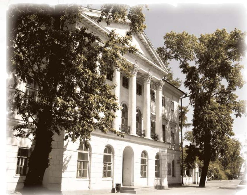
«Белый дом» — дворец генерал-губернатора в Иркутске (ныне — здание Научной библиотеки Иркутского государственного университета).

Жизнь женщин в те времена омрачалась высоким уровнем детской смертности. Медицина была бес-