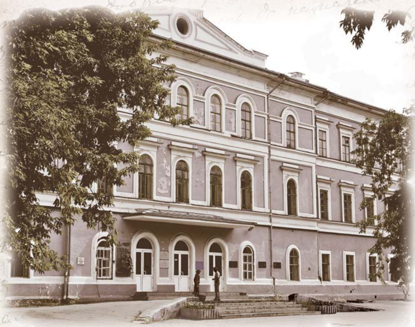
Здание бывшего Института благородных девиц Восточной Сибири в Иркутске.