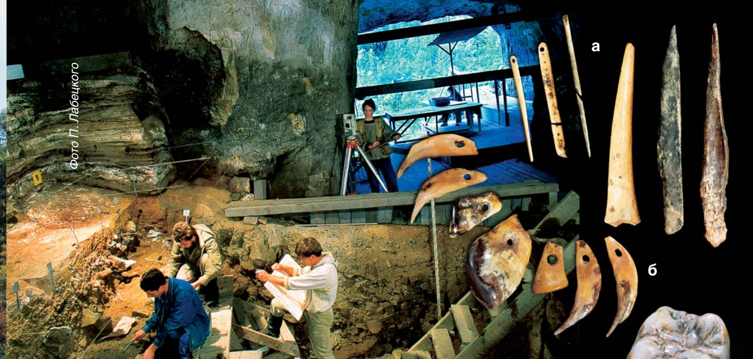
Кропотливое изучение следов жизнедеятельности далеких предков в Денисовой пещере.

В период от 50 тыс. до 40 тыс. лет назад на территории Алтая на основе местных традиций происходит постепенное становление культурного комплекса верхнего палеолита.