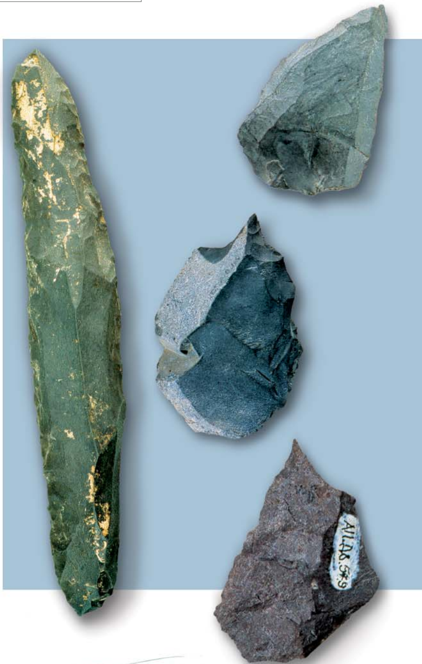
Орудия труда палеолитических обитателей долины Ануя.

Хотя исследования палеолитических памятников долины Ануя еще далеки от завершения, уже сейчас можно говорить о том, что в эпоху палеолита северо-западная часть Алтая была своеобразным оазисом, защищенным благодаря строению горного рельефа от активного влияния древних оледенений. В этом благоприятном природном окружении на протяжении плейстоцена развивалось первобытное сообщество, чье культурное влияние распространялось на территории Северной, Центральной и Восточной Азии.