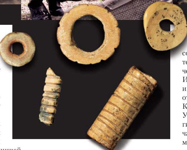
Костяные украшения эпохи палеолита из Денисовой пещеры.

Поселения первобытного человека — собирателя и охотника — были приурочены к наиболее удобным местам с богатым растительным и животным миром. Этим условиям