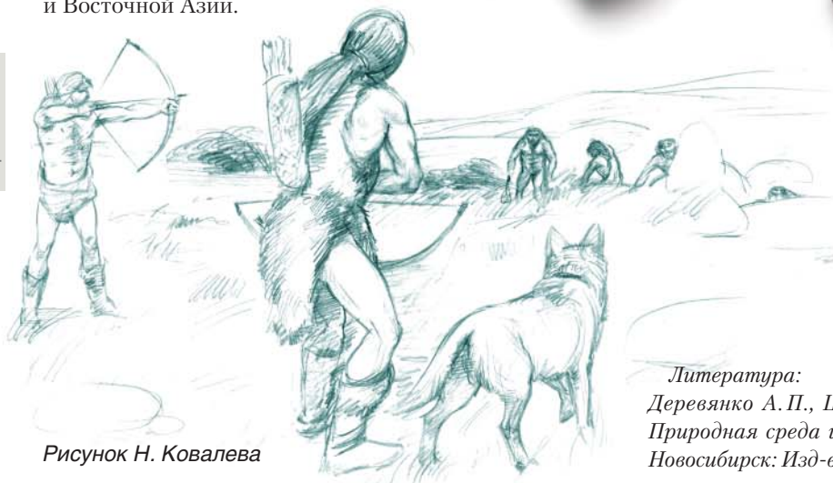
Рисунок Н. Ковалева

Литература: Деревянко А. П., Шуньков М. В., Агаджанян А. К. и др. Природная среда и человек в палеолите Горного Алтая. Новосибирск: Изд-во ИАЭТ СО РАН, 2003