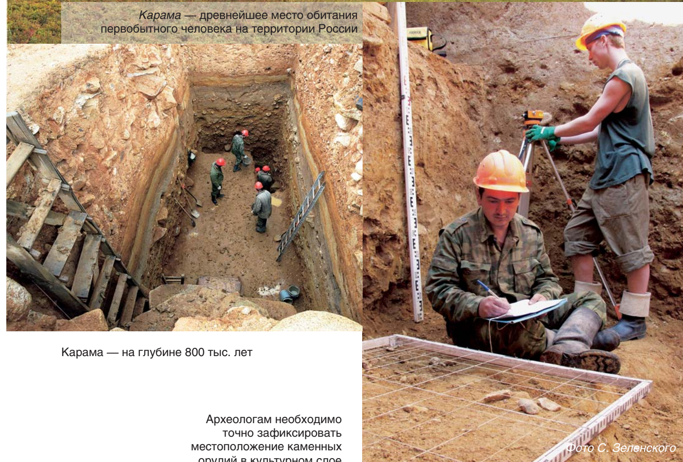
Карамы — на глубине 800 тыс. лет

Археологам необходимо точно зафиксировать местоположение каменных орудий в культурном слое