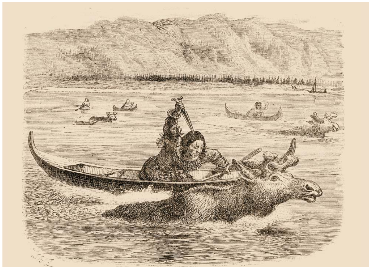
Поколка оленей. Занятие, распространенное у народов Чукотского полуострова. Рисунок второй половины XIX в. из книги: Народы России: Живописный альбом . — СПб., 1880

всех, кто отведал бы его мясо, обуяло бы точно такое же бешенство, как если бы они сами поели мухоморов».