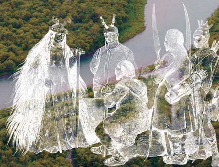
Якутская колдунья Рисунок из книги: Народы России: Живописный альбом.— СПб., 1880

Вторая Камчатская, или Великая Северная, экспедиция (1733—1743), проект которой разрабатывался Сенатом и Адмиралтейств-коллегией в Петербургской Академии наук, стала одной из крупномасштабных экспедиций в истории комплексного исследования природы и населения России. К сожалению, многие ценные документы и рукописи экспедиции: письма, путевые журналы, географические описания и т. д., — хранящиеся в фондах и архивах, совсем недавно увидели свет или только еще готовятся к изданию. Журнал «НАУКА из первых рук» неоднократно публиковал на своих страницах статьи, посвященные этому академическому проекту, в том числе жизни и научной деятельности участников экспедиции: Г. Ф. Миллера, И. Г. Гмелина, Г. В. Стеллера. Не остались без внимания и научные материалы Второй Камчатской экспедиции, касающиеся роли алкоголя в жизни русских сибиряков XVIII века. В данной статье говорится о распространении алкогольных напитков среди коренных жителей Сибири, а также об употреблении аборигенами грибов-галлюциногенов и наркотических средств, оказывающих возбуждающее и одурманивающее воздействие на их психику.