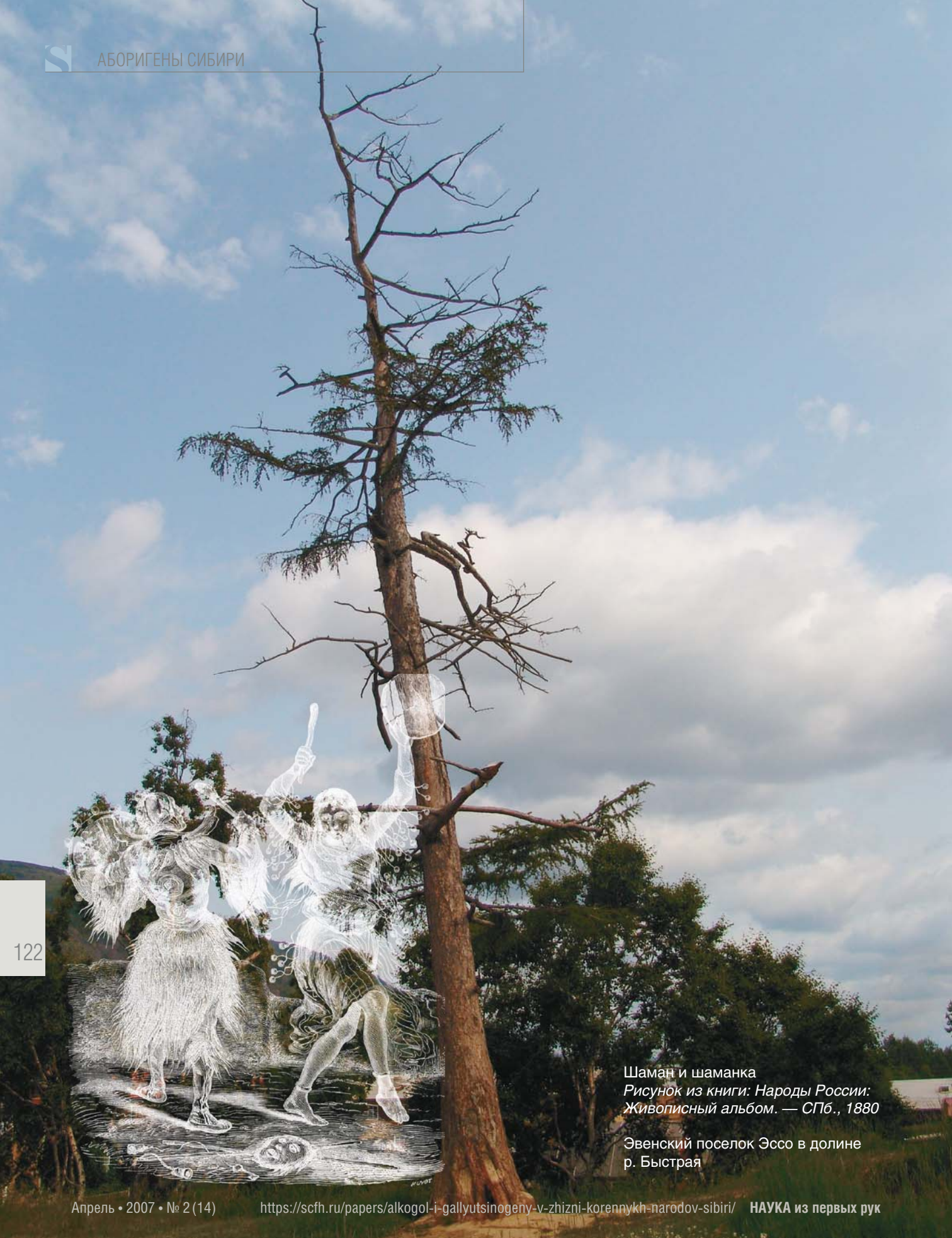
Шаман и шаманка Рисунок из книги: Народы России: Живописный альбом . — СПб., 1880