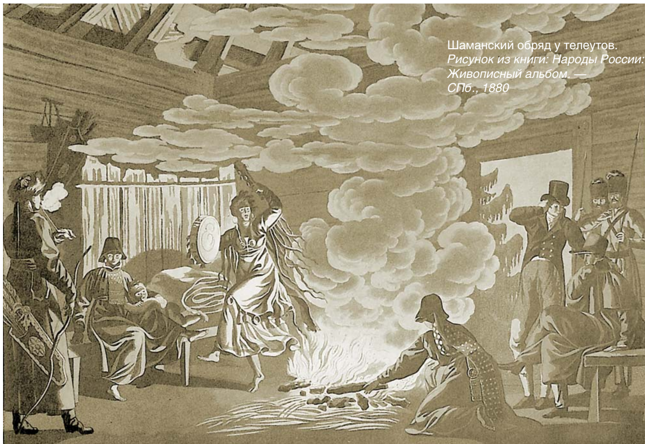
Шаманский обряд у телеутов. Рисунок из книги: Народы России: Живописный альбом . — СПб., 1880

«Слово Chanı означает дикий, поскольку в это время они [буряты] постоянно напиваются пьяными». Миллеру вторит Крашенинников, который, характеризуя «братских татар» (бурят), сообщает следующее: «В летнее время так, как и прочие татары, мужики и бабы, и малые ребята всегда пьяны, потому что <...> из кобыльа молока они вино сидят».