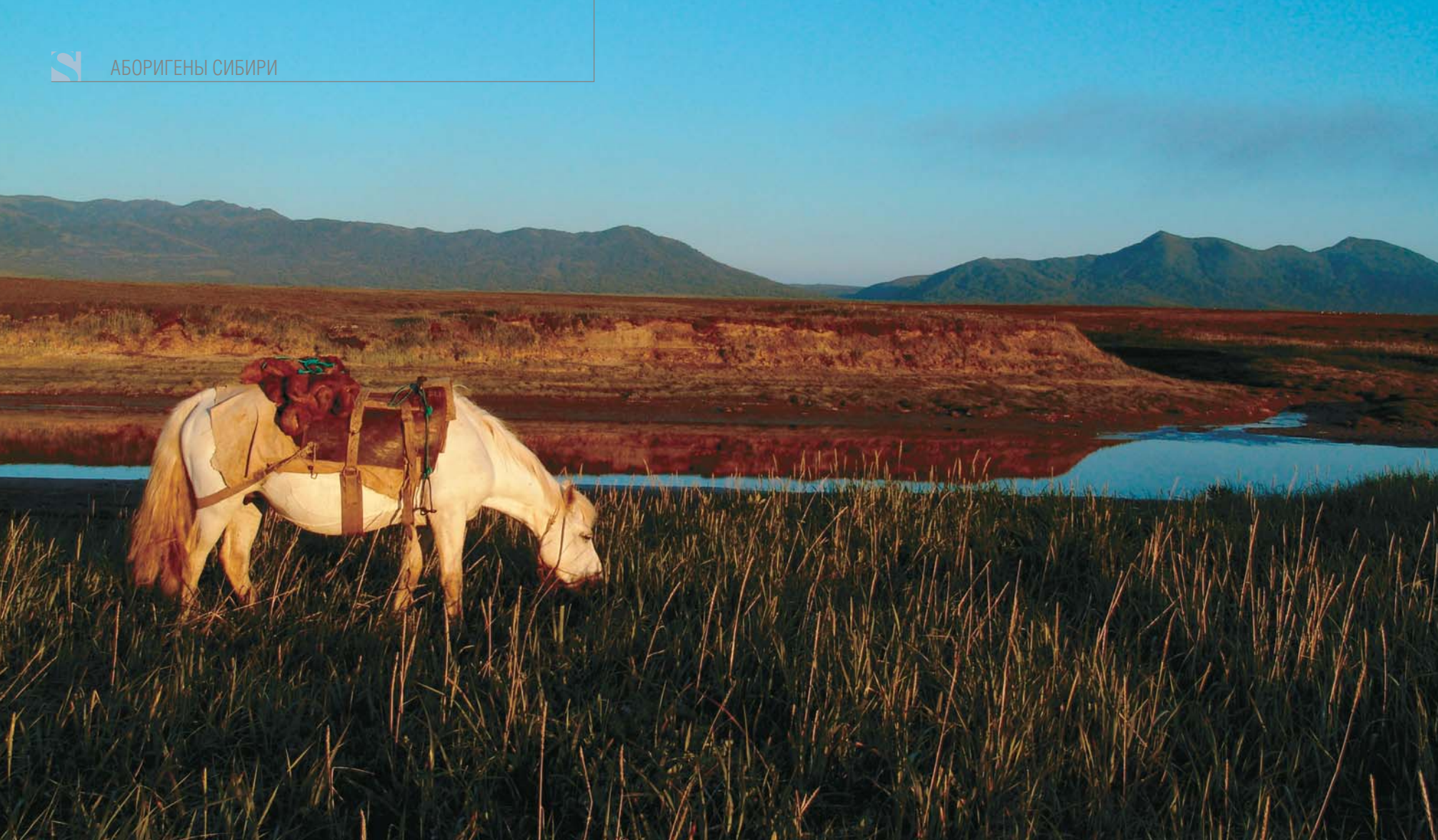
Тундра в окрестностях дер. Лесная (Тигильский район. Корякский АО)

В Сибири кумыс издавна изготавливали как из кобыльего, так и из коровьего молока. На фото — бурятская корова и сибирская лошадь кузнецкой породы