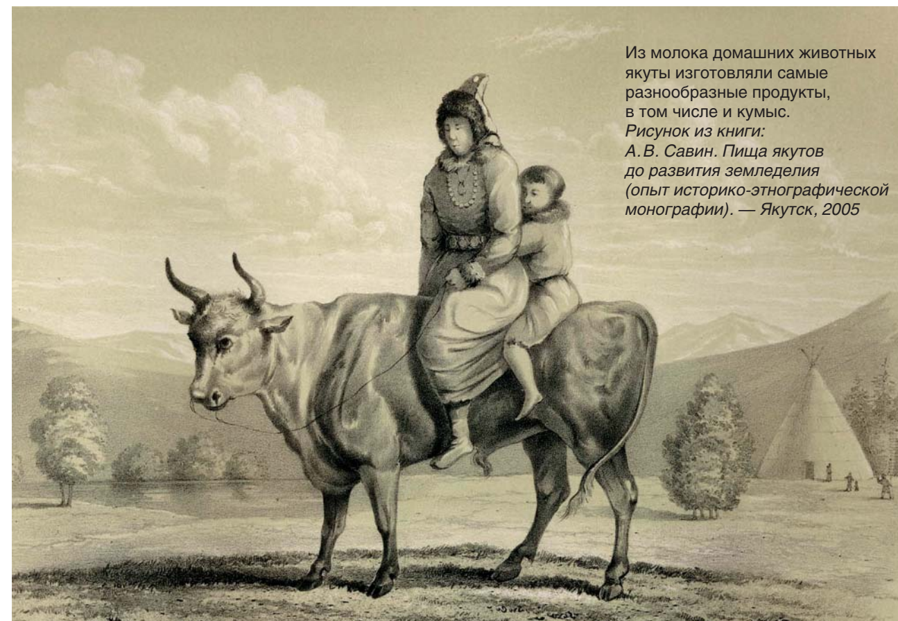
Из молока домашних животных якуты изготавливали самые разнообразные продукты, в том числе и кумыс. Рисунок из книги: А. В. Савин. Пища якутов до развития земледелия (опыт историко-этнографической монографии). — Якутск, 2005

К вопросу о качестве молочной водки Миллер обращался неоднократно, каждый раз приходя к одному и тому же выводу: водка из кобыльего кумыса хуже, чем хлебная, но лучше, чем из кумыса коровьего. Он отмечает, что сибирские татары «изготавливают водку также и из коровьего молока, после того, как с него снято масло, но она хуже и от нее болит голова». Об этом же, собственно, писал и Гмелин, однако в оценке крепости водки из коровьего молока исследователи расходятся. По свидетельству опрошенных Гмелином нерчинских тунгусов, она напоминает водку из молока кобыльего: «Мы действительно увидели, что водка, выгнанная в нашем присутствии из коровьего молока, была такой крепкой, что ее можно было поджечь». Впрочем, в другом случае исследователь утверждает, что «кумыс из кобыльего молока дает больше алкоголя, чем приготовленный из коровьего».