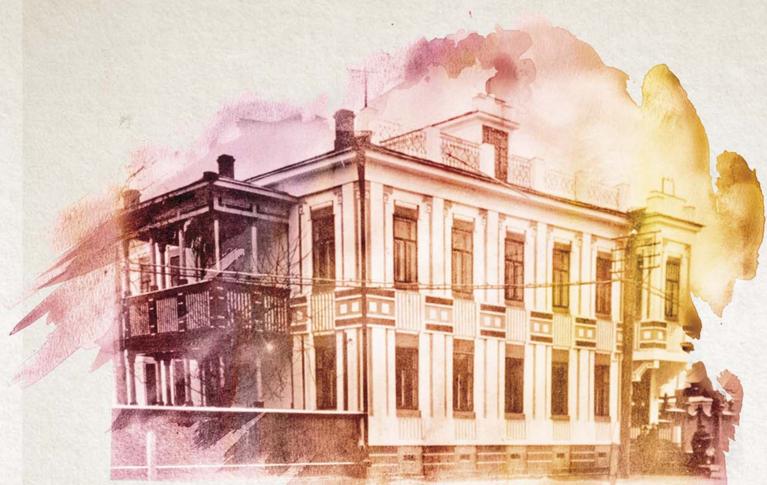
В феврале 1924 г. Норвегия установила дипломатические отношения с СССР. Вверху – здание норвежского генерального консульства в Архангельске, 1930 г.

Показательно здесь разочарование Савицкого в союзниках по Антанте и западных либеральных демократиях, которые во время гражданской войны преследовали в России свои узкокорыстные политические и экономические интересы. Вместе с тем любопытно и то, что с переходом на позиции евразийства Савицкий решительно осудил, как он писал, «воинствующий экономизм» как либералов-западников, так и большевиков за их оторванность от религиозно-нравственных и духовных основ жизни общества. Возможно, что в отношении советского государства Савицкий все-таки ошибался, ибо как раз в СССР политика и идеология, напротив, всегда шли впереди экономики. И именно там парадоксальным образом были реализованы на практике некоторые экономико-географические идеи ученого.