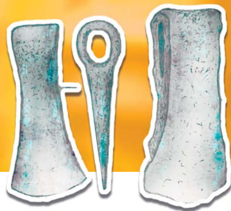
Чудской экспорт. Топоры. Железо