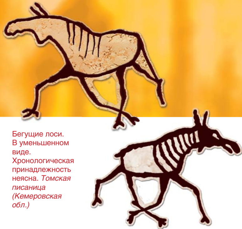
Бегущие лоси. В уменьшенном виде. Хронологическая принадлежность неясна. Томская писаница (Кемеровская обл.)