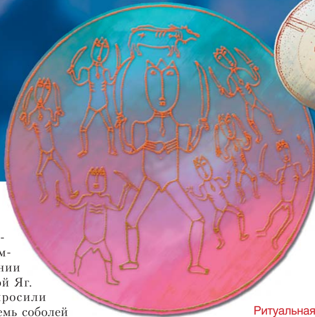
Ритуальная пляска обско- угорских воинов.

В центре — фигура богатыря- военачальника. Гравировка на дне серебряного ковша. Вторая половина I тыс. н. э. Коцкий городок (Тобольская губ.)