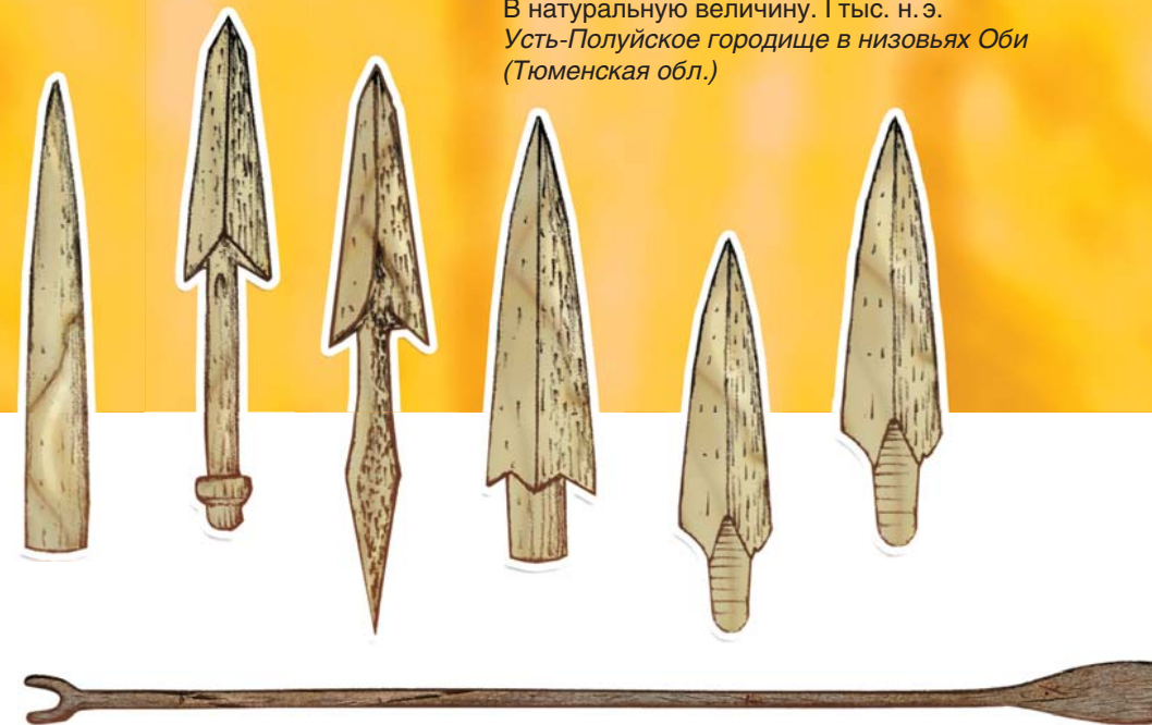
Деревянная стрела с тупым наконечником (томар). В уменьшенном виде. Этнография

целое. Ширина купола в основании не менее четырех саженей, высота на голову превышала рослого не по ас-яхски Ортана. Сложенная из разновеликих коряжистых бревен, скрепленная вязкой илистой грязью, бобровая юрта и летом была недоступна никакому зверю, даже медведю, а зимою, скованная морозом, не уступала твердостью камню и железу. Склонив голову в приветственном поклоне, Рач сказал: