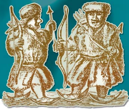
Северные самоеды (касы)