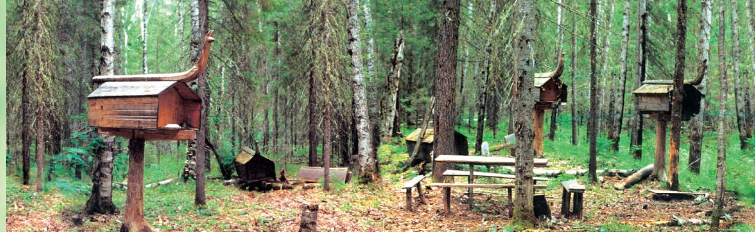
Культовое место Мис-хум-ойки.

КОСАРЕВ Михаил Федорович — доктор исторических наук, ведущий научный сотрудник Института археологии РАН (Москва). Более 40 лет вел активные археолого-этнографические исследования. Опубликовал около 200 научных трудов, в том числе монографии «Древняя история Западной Сибири: человек и природная среда», «Язычество Сибири» и др.