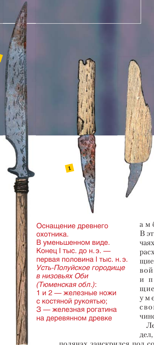
Оснащение древнего охотника. В уменьшенном виде. Конец I тыс. до н.э. — первая половина I тыс. н.э. Усть-Полуйское городище в низовьях Оби (Тюменская обл.): 1 и 2 — железные ножи с костяной рукоятью; 3 — железная рогатина на деревянном древке

Дважды пересекли чистую строчку соболяго следа. Видели и самого соболя, мелькнувшего темной молнией по гребню длинной колодины. Впереди, пересекая путь, проскакал ушастый беляк, следом меж кустами мелькнула огненно-рыжая спина. Заметив людей, лиса приостановилась, повернулась белой грудкой и, махнув хвостом, скрылась среди деревьев.