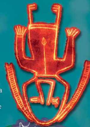
Убитый обско-угорский богатырь. Гравировка на блюде. Вторая половина 1 тыс. н. э. Река Сосьва (Свердловская обл.)