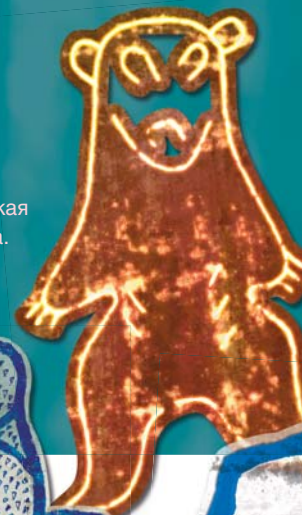
Древние изображения медведя: 1. Хронологическая принадлежность неясна. Томская писаница. 2. Гравировка на бронзовой бляхе. На рубеже эр. Тюменская обл.