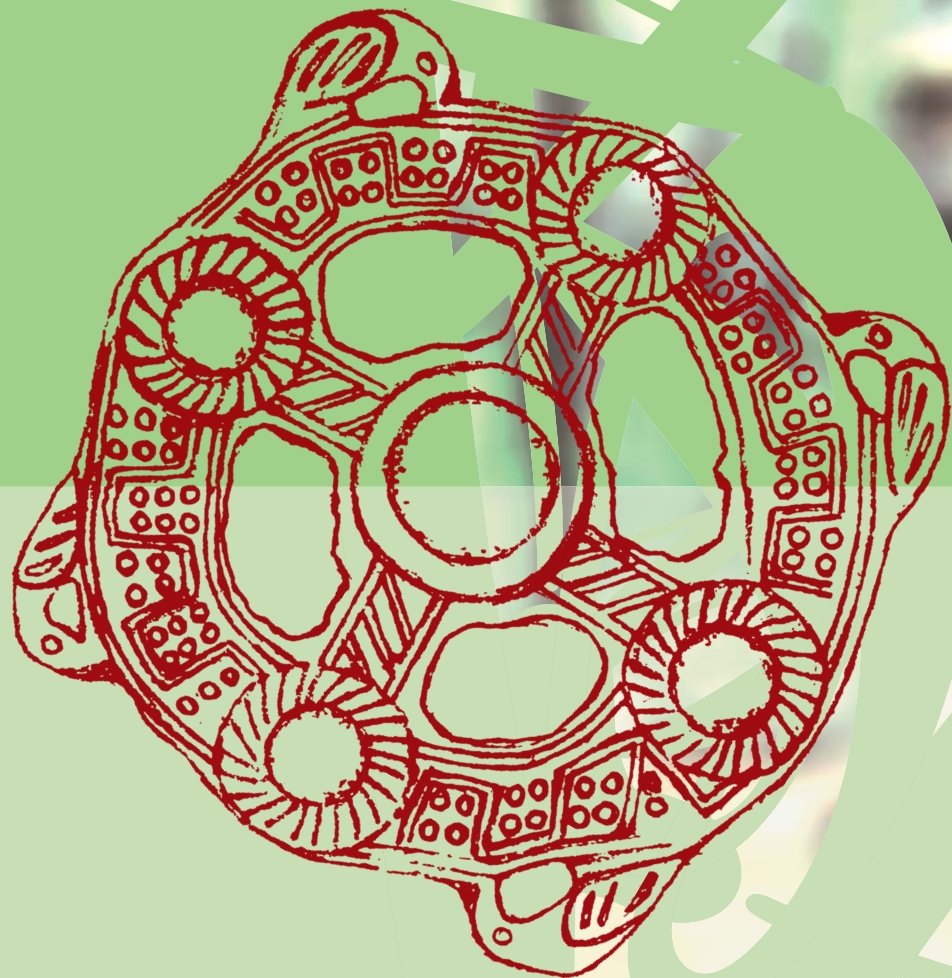
Схема мироздания. Бронза, VI—IX вв. н. э. Релкинский могильник в Среднем Приобье (Томская обл.)