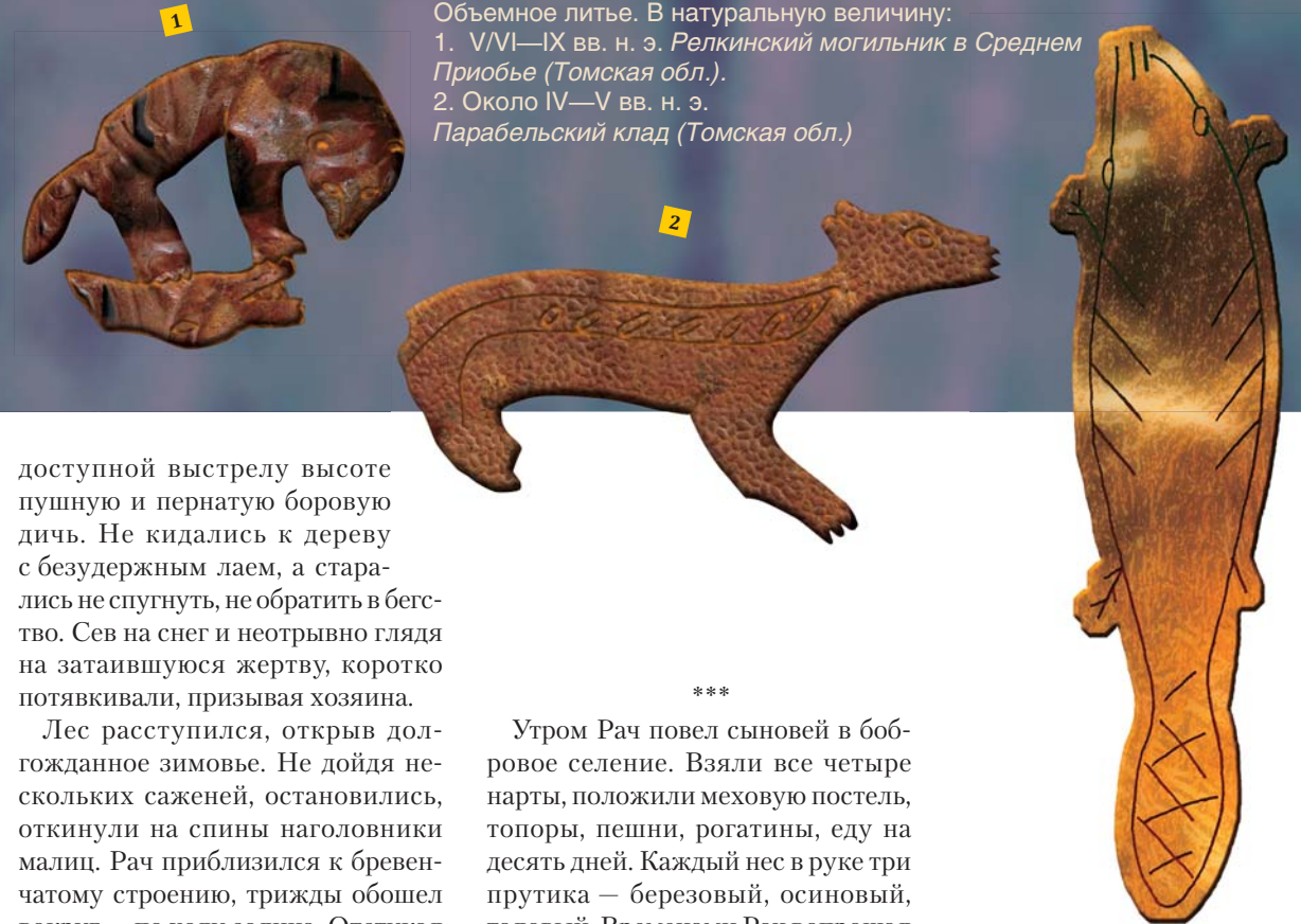
Промысловые пушные звери. Бронза. Объемное литье. В натуральную величину: 1. V/VI—IX вв. н.э. Релкинский могильник в Среднем Приобье (Томская обл.). 2. Около IV—V вв. н.э. Парабельский клад (Томская обл.)

Ни у одного таежного народа не было собак, превосходящих в охотничьем умении ас-яхских псов. Они обладали хорошим слухом, чутким обонянием, острым зрением. Были послушны, умны, преданны. Гнали по черностою и белотропу в нужное охотнику место оленя и лося, держали, сколько потребуется, на