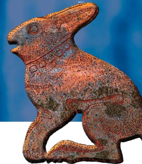
Заяц. Бронза. Объемное литье. В натуральную величину. Около VI—IX вв. н. э. Архирейская заимка близ Томска