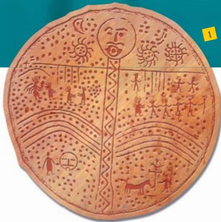
Шаманские бубны: 1 — алтайский, 2 — кетский