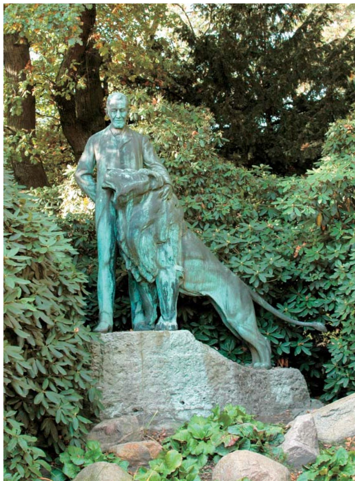
Бронзовый памятник основателю зоопарка Карлу Гагенбеку (1844—1913), изображенному с любимым ручным львом Триестом, который спас жизнь своему хозяину во время одного из цирковых представлений, когда на него напали вышедшие из повиновения тигры

Революционные события 1848 г. в Германии заставили Гагенбека срочно продать тюленей в Берлине и вернуться в Гамбург, однако начало торговли дикими животными было положено. Вскоре предприниматель купил взрослого белого медведя, привезенного в Гам-