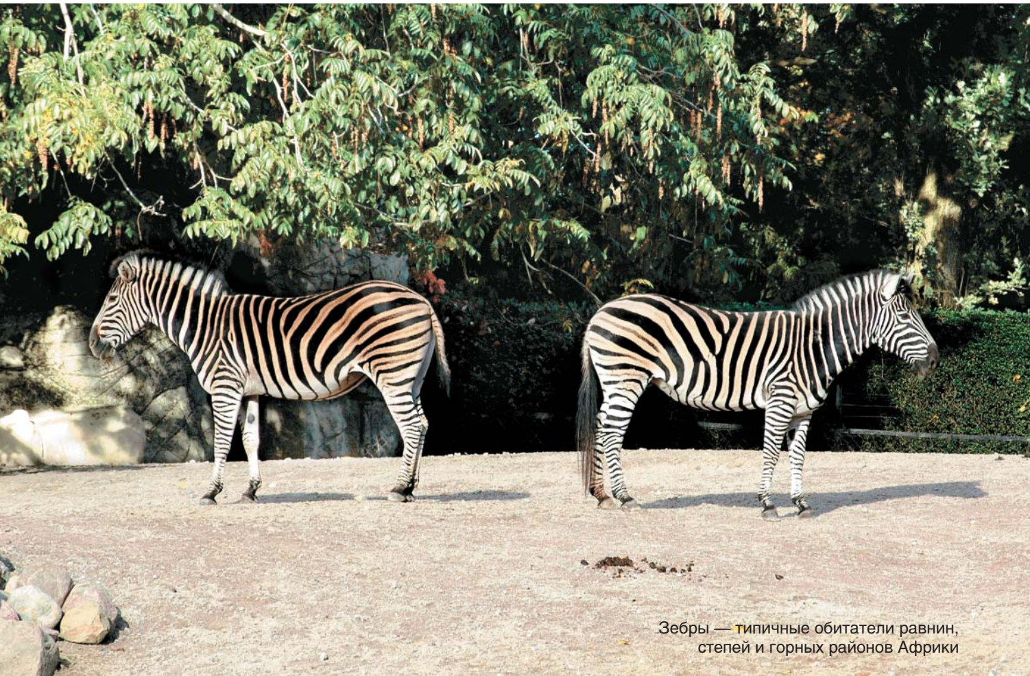
Зебры — типичные обитатели равнин, степей и горных районов Африки

Первыми были лапландцы, потом — нубийцы, эскимосы и сомалийцы, калмыки и индейцы племени сиу, а также сингалезы и готтентоты — обитатели самых отдаленных уголков нашей планеты.