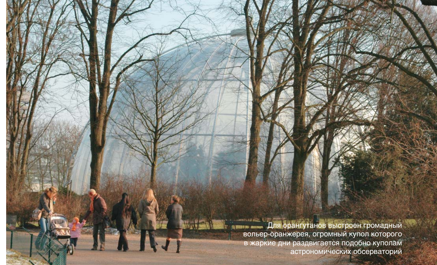
Для орангутанов выстроен громадный вольер-оранжерея, огромный купол которого в жаркие дни раздвигается подобно куполам астрономических обсерваторий

Н овый зоопарк был открыт для посетителей 7 мая 1907 г. После смерти Карла Гагенбека в 1913 г. руководство зоопарком, фирмой и цирками перешло к его сыновьям, которые достойно продолжили дело отца, несмотря на многочисленные трудности. Так, во время Второй мировой войны в результате 90-минутной бомбардировки зоопарк был практически полностью разрушен. Однако уже год спустя сооружение удалось восстановить. В расчистке территории активное участие приняли и слоны, содержащиеся в зоопарке.