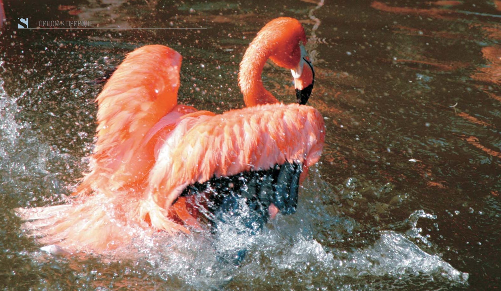
Оперение обитателей соленых лагун, красных фламинго, напоминающих цветы на воде, удивительно контрастирует с белыми покровами полярной совы