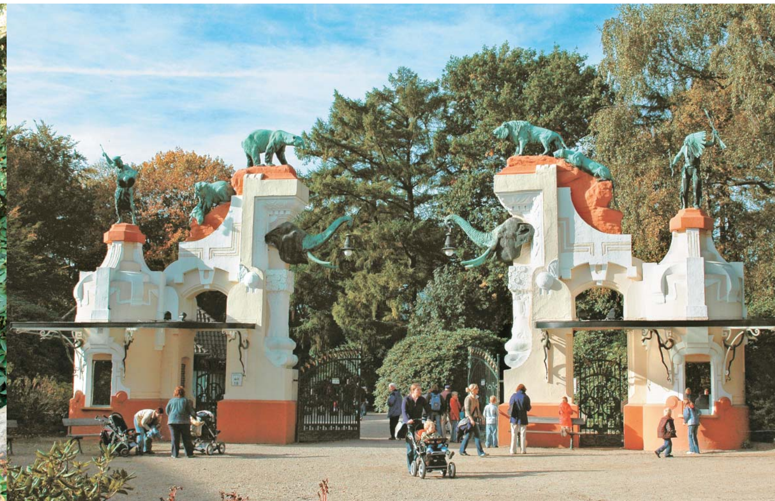
Через эти ворота, украшенные отлитыми из бронзы головами слонов, а также фигурами львов, белых медведей, африканского воина и североамериканского индейца, в 1907 г. входили в зоопарк первые посетители. Выполненные по проекту дюссельдорфского художника и скульптора И. Палленберга в модном для того времени стиле модерн, они до сих пор украшают зоопарк, однако сегодня, в связи с расширением его границ, переместились внутрь

тюленями — байкальскими нерпами, а «в делях» Уссурийского края в избытке водились самые крупные в мире уссурийские тигры и дальневосточные леопарды. В дуплах больших деревьев гнездились нарядные утки-мандаринки, по красоте брачного оперения не уступающие тропическим райским птицам. На Алтае обитали крупные дикие бараны (архары или аргали) с великолепными завитыми рогами; сибирские козероги, длина рога которых достигала полутора метров; удивительные ирбисы — снежные барсы... Здесь же можно было встретить диких лошадей, описанных