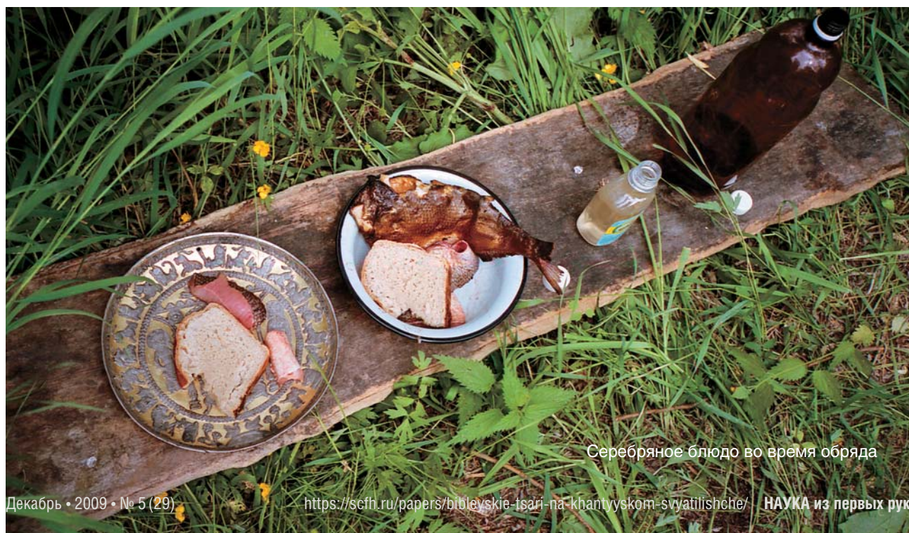
Серебряное блюдо во время обряда

С другой стороны, фигуры животных могли относиться в равной степени и к Соломону, который (по апокрифу) знал язык всех зверей.