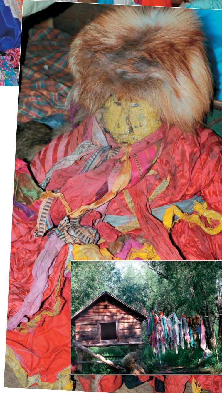
Главное местное божество, охраняющее блюдо

«Семь блюд и все одинаковые»... Мне посчастливилось держать в руках и Нильдинское блюдо, и блюдо с хантыйского святилища на Малой Оби. Они действительно одинаковые: по форме, диаметру, весу, металлу, способу изготовления, – все это видно в первые мгновения.