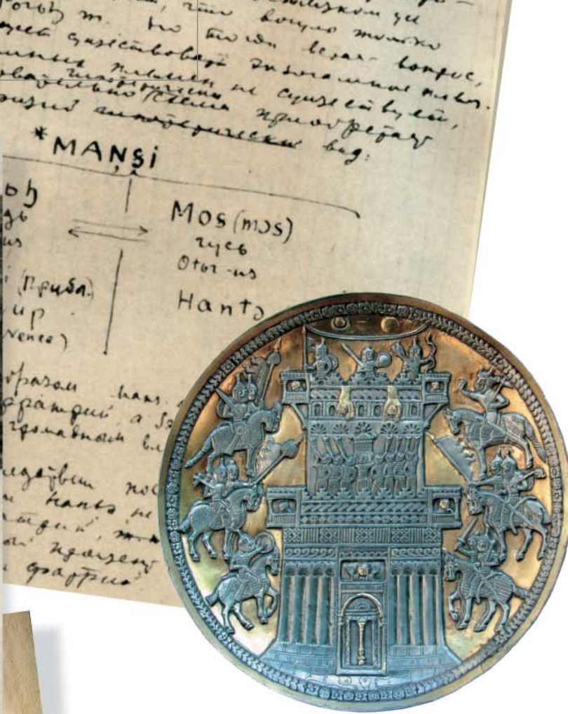
Нильдинское блюдо. Средняя Азия, VIII — начало IX вв.