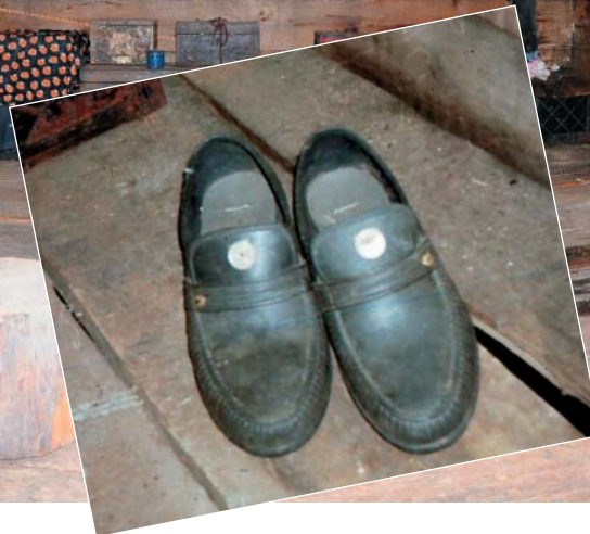
«Чистые» ботинки, которые надеваются только для совершения обряда