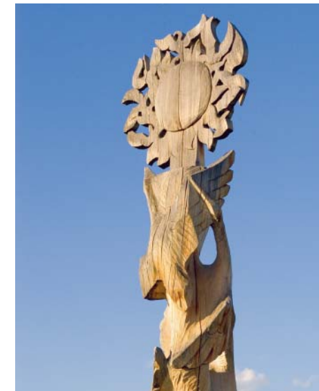
Современная скульптура на месте проведения якутского национального праздника ЫСЫАХ. Фото В. Короткоручко

Черно-белые фото — из монографии якутского этнографа Андрея Андреевича Саввина (1896—1951) «Пища якутов до развития земледелия (опыт историко-этнографической монографии)» (Якутск, 2005)