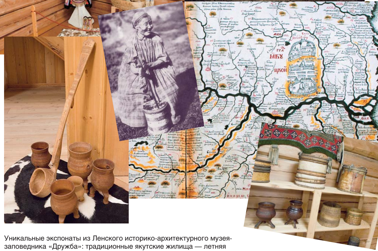
Уникальные экспонаты из Ленского историко-архитектурного музея-заповедника «Дружба»: традиционные якутские жилища — летняя хижина из бересты, зимний балаган, детская одежда, люлька, посуда для кумыса, копия Спасо-Зашиверской церкви из музея под открытым небом ИАЭТ СО РАН

наподобие гагары, притворялся, будто хочет встать, но якобы не может. Разъяснение якутов при этом такое. Черти живут в земле на глубину девяти ярусов. Каждый ярус заселен чертями особого рода, и все они должны быть преодолены, пока не прибудешь в нижний ярус знатнейшего черта, который имеет власть над остальными. По их, якутов, мнению, шаман в своем экстазе действительно проходит вместе с жертвенной скотиной через все девять ярусов и, наконец, доставляет скотину главнейшему черту. То, что он лежит на земле и вышеуказанным образом жестикулирует руками и двигает ногами, а также делает вид, будто бы хочет встать, но