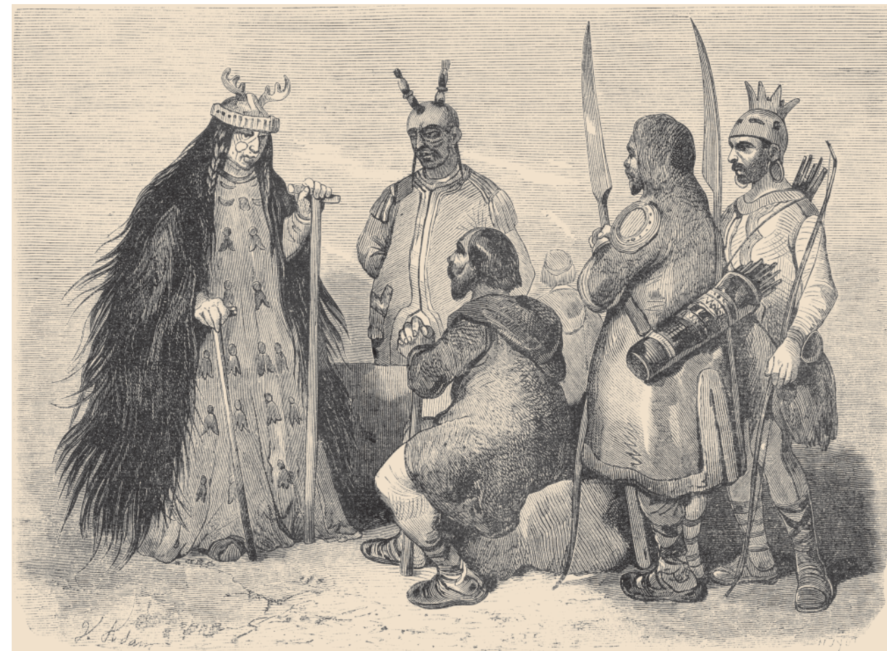
Якутская колдунья. Рисунок второй половины XIX в. Народы России: Живописный альбом. СПб., 1880

Девятнадцатого и двадцатого июня 1737 г. видел у якутов в семи верстах ниже города Якутска, как они приносят жертву своим чертям.