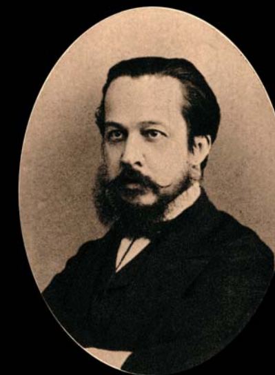
Граф А. С. Уваров