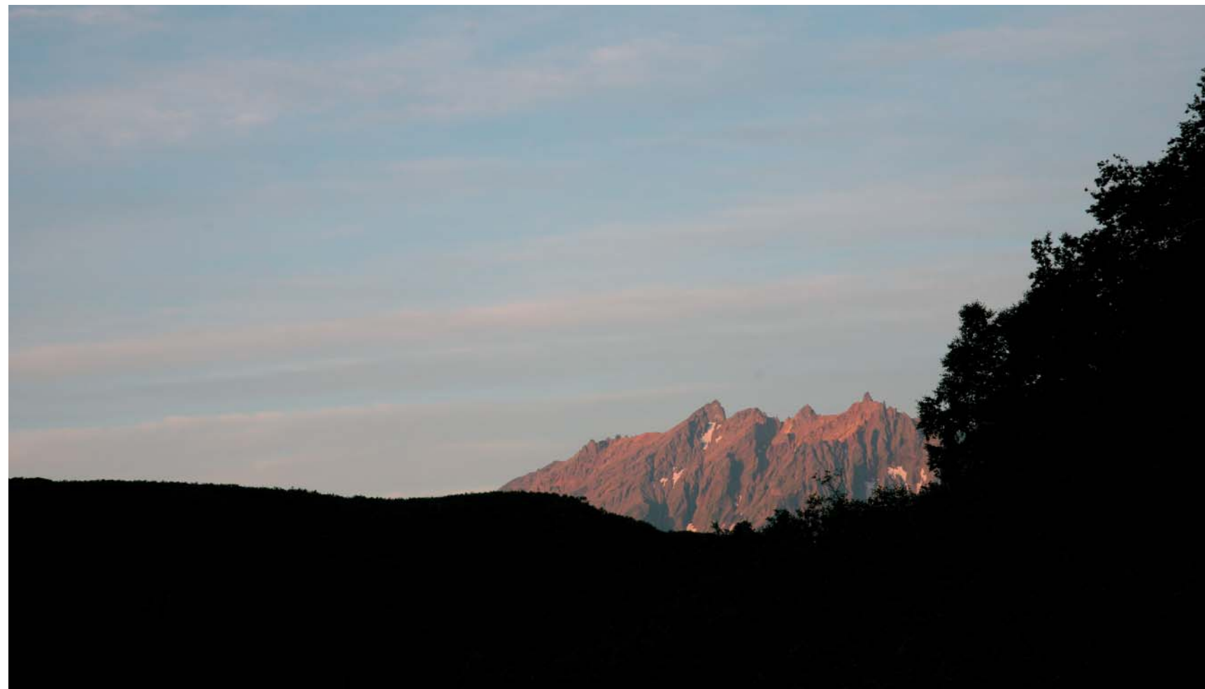
Затерянный мир охраняют горы, над которыми возвышаются острые шпили горы Зубчатки